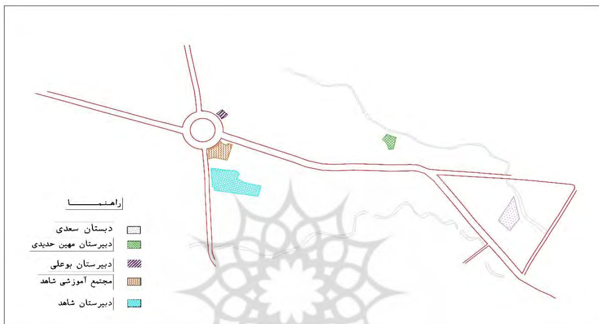
نقشه شماره ۴: مدارس محله فردوسی کرمانشاه (USGB, 2014 & Darabi 2021)

بررسی صورت گرفته وجود ۲ دبستان و ۲ مدرسه راهنمایی و دبیرستان در محله امکان دسترسی به فضاهای آموزشی را برای حداقل ۵۰٪ واحدهای مسکونی، در شعاع دسترسی ۸۰۰ متری برای دبستان و راهنمایی و همچنین ۱۶۰۰ متری از دبیرستان برای دانش‌آموزان فراهم آورده است (نقشه شماره ۴).