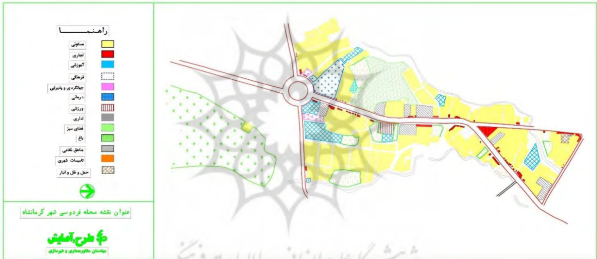
نقشه شماره ۱: کاربری های محله فردوسی، مهندسین مشاور معماری و شهرسازی. مسکن و شهرسازی