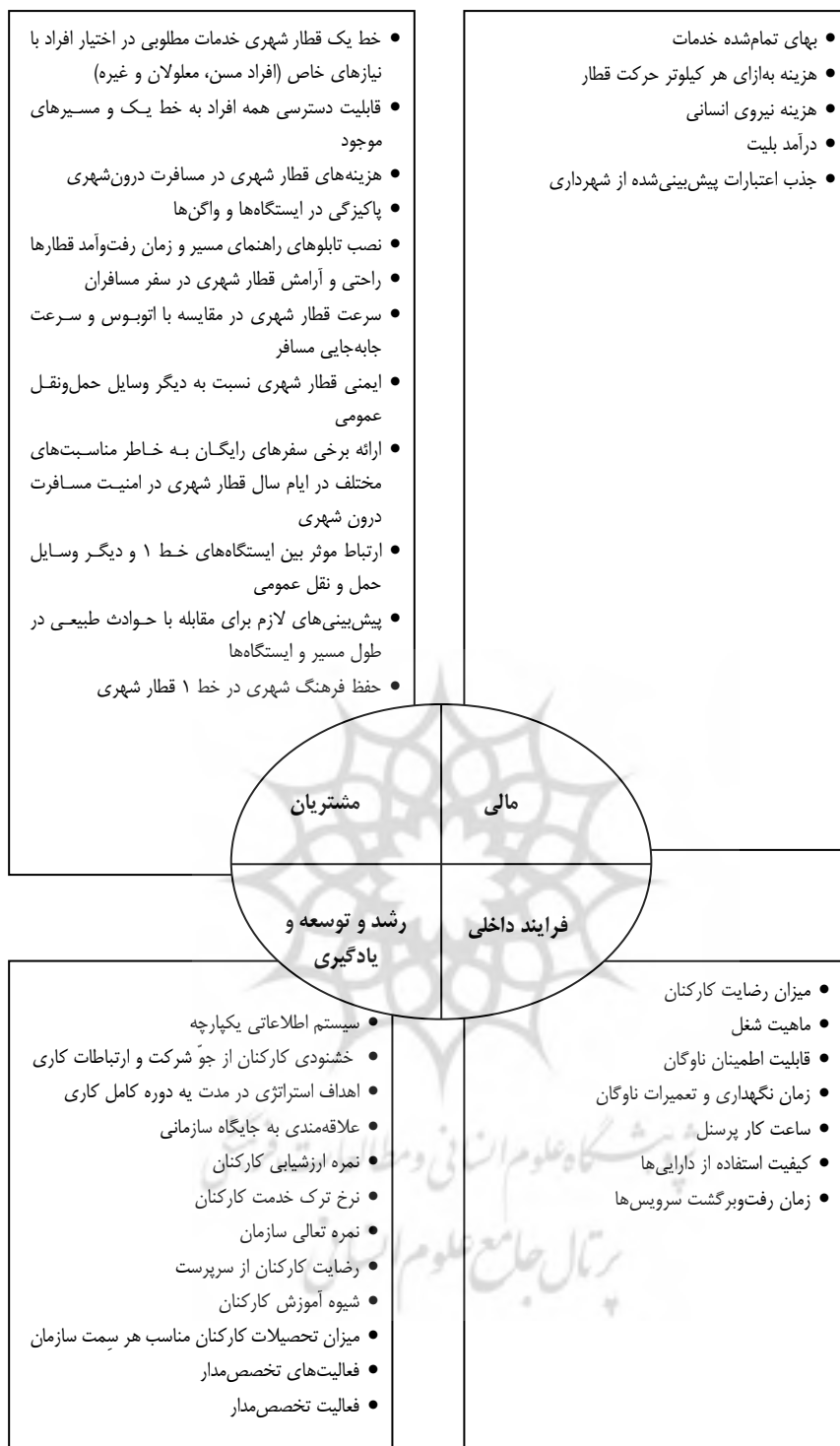
شکل ۳. معیارهای شناسایی‌شده توسط خبرگان شرکت بهره‌برداری قطار شهری مشهد