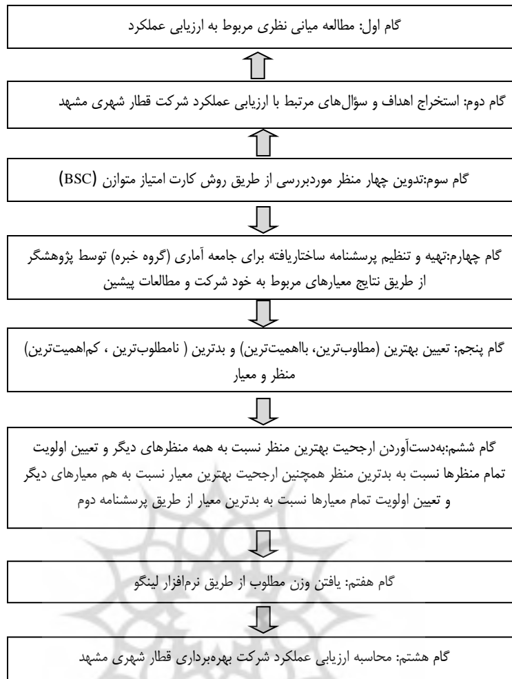
شکل ۲. گام‌های مورد بررسی در پژوهش حاضر