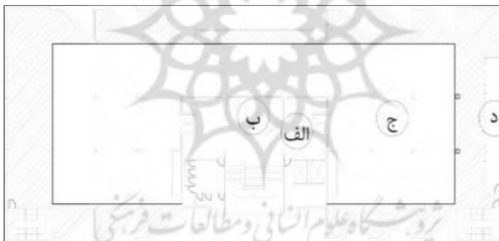
شکل (۱): پلان طبقه سوم قرائت‌خانه مرکزی دانشگاه تهران (الف: راهرو، ب: وید ۲ ، ج: سالن قرائت، د: بالکن)

کتابخانه مرکزی دانشگاه تهران، در بخش میانی مجتمع خوابگاه و در زمینی به مساحت ۲۵۰۰ مترمربع، شامل پنج طبقه (یک طبقه زیرزمین و چهار طبقه روی آن) احداث گردیده است. از مجموع طبقات روی زیرزمین، نصف مساحت طبقه همکف به مخزن کتاب و نصف مساحت طبقه اول به سایت کامپیوتری اختصاص داده شده و مابقی فضا مخصوص مطالعه می‌باشد.