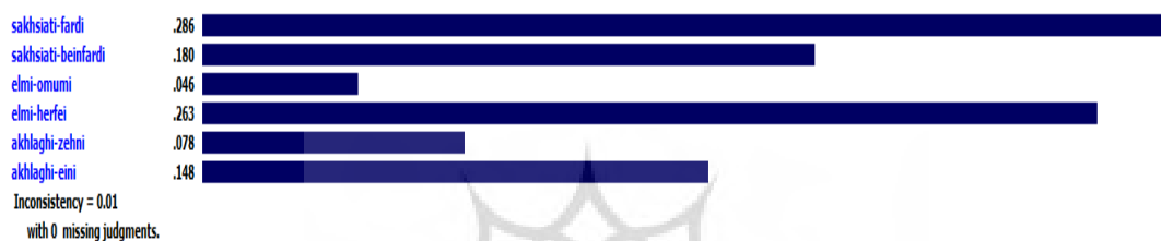
شکل ۲- وزن شایستگی ها

سپس با استفاده از نرم افزار اکسپرت چویس تحلیل داده ها انجام شد و وزن شایستگی ها مشخص گردید که در شکل دو نشان داده شده است.