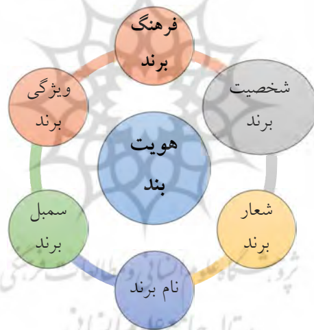
شکل شماره ۱) عناصر هویت مقصد (Cia, 2002: 722).

هویت برند مفهوم اصلی محصول با خدمت است که قادر است آن را به صورت شاخص و متمایز تعریف نماید. در مورد کالاهای تجاری شماره لوگو، بسته‌بندی و طراحی خود محصول می‌تواند توصیف کننده‌ی هویت باشد. اما در مورد شهرها، کشورها و ملیت‌ها موضوع قدری پیچیده‌تر خواهد بود و استفاده از ابزارهای ارتباطی متداول در برندسازی تجاری (به طور مثال طرح‌های گرافیکی) برای انتقال کامل پیام به مخاطب چندان کاربردی نخواهد داشت (Anholt, 2007). پیش نیاز استفاده از استراتژی‌های توسعه‌ی برند برای ایجاد تصویر ذهنی مناسب از مقصد گردشگری، آرایه‌ی تعریفی مشخص از هویت آن است. توسعه‌ی برند مقصد گردشگری در حقیقت تلاشی برای متمایزسازی آن از سایر رقبا از طریق انتقال هویت شاخص و منحصر به فرد برند به مخاطبان است (Morrison & Anderson, 2002). عناصر یک برند منسجم و سازگار همدیگر را تقویت می‌کنند که منجر به یکی شدن روند شکل‌گیری و ساخت تصویر می‌شود که به نوبه‌ی خود به قدرت و منحصر به فردی هویت برند کمک می‌کند (Cia, 2002: 722).