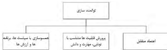
شکل ۱- ابعاد توانمندسازی

برابر پروژه محور، انکشاف منابع درونی در برابر تزریق منابع بیرونی، تسهیل‌گری دوسویه در برابر تأمین‌کنندگی یکسویه می‌باشد (زالی و همکاران، ۱۳۹۴: ۱۱۵).