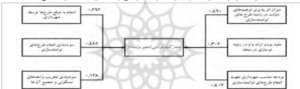
شکل ۴- نمودار تحلیل مسیر میان مشارکت مردمی و شاخص‌های کنش عقلانی

نتایج حاصل از تحلیل مدل مسیر نشان داد که شاخص‌های اثرپذیری توصیه‌های دولت در زمینه طرح‌های توانمندسازی و سودمندی انجام طرح‌های توانمندسازی بیشترین میزان اثرگذاری؛ و شاخص‌های سودمندی تخریب واحدهای مسکونی و تجمیع آن‌ها و انجام به موقع طرح‌ها توسط شهرداری، کمترین میزان تأثیرگذاری را بر میزان مشارکت مردمی دارند.