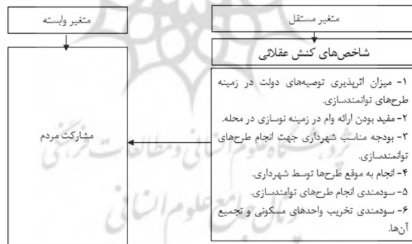
شکل ۲- مدل مفهومی تحقیق

ارائه وام برای نوسازی محله می‌تواند هزینه‌های بهسازی محله را به طرز چشمگیری کاهش دهد؟، آیا تخریب واحدهای مسکونی و تجمیع آن‌ها به نفع محله است؟، میزان اعتماد به شهرداری‌ها جهت اتمام طرح‌های توانمندسازی با بودجه مناسب، تا چه اندازه می‌باشد؟، میزان اعتماد به شهرداری‌ها جهت اتمام به موقع طرح‌های توانمندسازی تا چه اندازه می‌باشد؟ و در مجموع آیا اجرای طرح‌های توانمندسازی به لحاظ هزینه و منفعت به سود محله خواهد بود؟ (زالی و همکاران، ۱۳۹۴: ۱۱۵)، لازم به ذکر است که پاسخ به این سؤالات می‌تواند ما را به شناختی کامل در زمینه میزان تمایل ساکنان به مشارکت در طرح‌های توانمندسازی سکونتگاه‌های غیررسمی رهنمون سازد. در ادامه ۶ شاخص کنش عقلانی مطرح می‌شود: میزان اثرپذیری توصیه‌های دولت در زمینه طرح‌های توانمندسازی؛ مفید بودن ارائه وام در زمینه نوسازی در محله؛ بودجه مناسب شهرداری جهت اتمام طرح‌های توانمندسازی؛ اتمام به موقع طرح‌ها توسط شهرداری؛ سودمندی اتمام طرح‌های توانمندسازی؛ سودمندی تخریب واحدهای مسکونی و تجمیع واحدهای مسکونی و تجمیع آن‌ها. در پژوهش حاضر شاخص‌های کنش عقلانی (هزینه-منفعت) به عنوان متغیرهای مستقل و مشارکت مردم به عنوان متغیر وابسته در نظر گرفته شده است. در شکل (۲) مدل مفهومی تحقیق ارائه شده است: