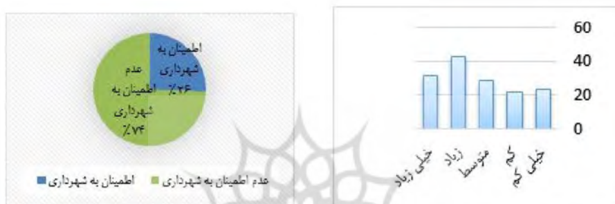
نمودار ۲- نظرسنجی در مورد بودجه مناسب شهرداری جهت انجام طرح‌های توانمندسازی نمودار ۳- اطمینان از انجام به موقع طرح‌ها توسط شهرداری مأخذ: نگارندگان

نتایج یافته‌ها حاکی از آن است که ۶۱٫۲۹٪ از خانوارها ارائه وام برای نوسازی محله‌های وکیل‌آباد و اسلام‌آباد (۲) را مفید و ۳۹٪ مضر می‌دانند. همچنین نتایج تحلیل یافته‌ها نشان می‌دهد که ۷۲٪ از ساکنان به تخریب واحدهای مسکونی و تجمیع آن‌ها راغب هستند و ۲۸٪ مخالف این امر می‌باشند. نتایج بررسی‌ها نشان داد که ۳۲ خانوار بر تخصیص بودجه مناسب از سوی شهرداری جهت انجام طرح‌های توانمندسازی تأکید داشتند و ۳۴ خانوار این امر را الزامی ندانستند (نمودار ۲). همچنین یافته‌ها حاکی از آن است که به اعتقاد مردم، شهرداری‌ها حتی در صورت داشتن بودجه کافی، آن را صرف انجام طرح‌های توانمندسازی سکونتگاه‌های غیررسمی نمی‌کنند (نمودار ۳).