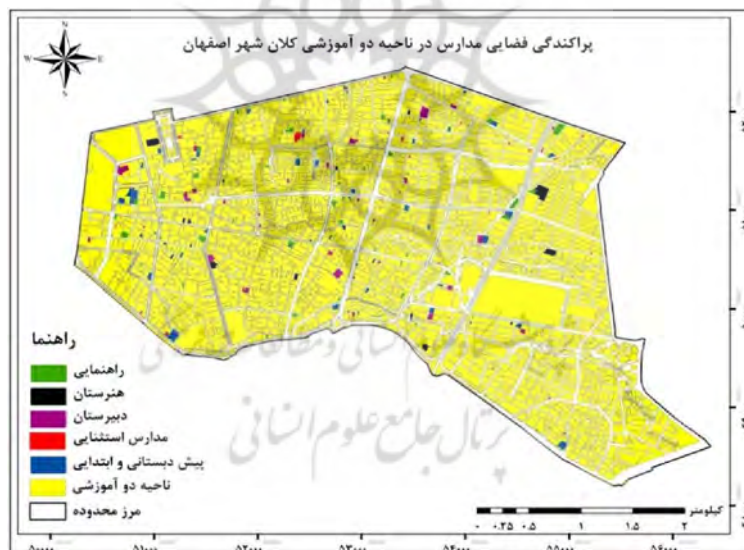
نقشه (۲): نقشه پراکنش فضایی مدارس در ناحیه دو آموزشی کلانشهر اصفهان. بازترسیم: نگارندگان