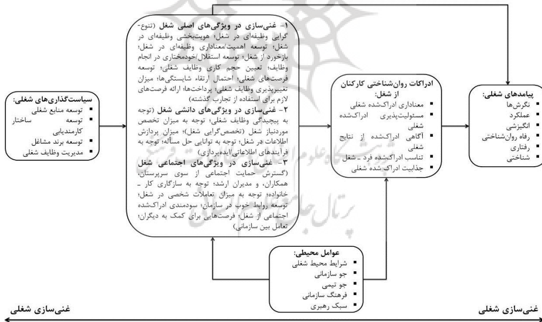
شکل ۱. مدل غنی سازی شغلی

گرایش به غنی سازی در ویژگی‌های اصلی شغل اشاره دارد. این گرایش در مورد ماهیت و فلسفه‌ی شغل می‌باشد. جایی که طراحان مشاغل به هنگام بحث درباره‌ی کم و کیف یک شغل، می‌بایست در همان ابتدای کار این