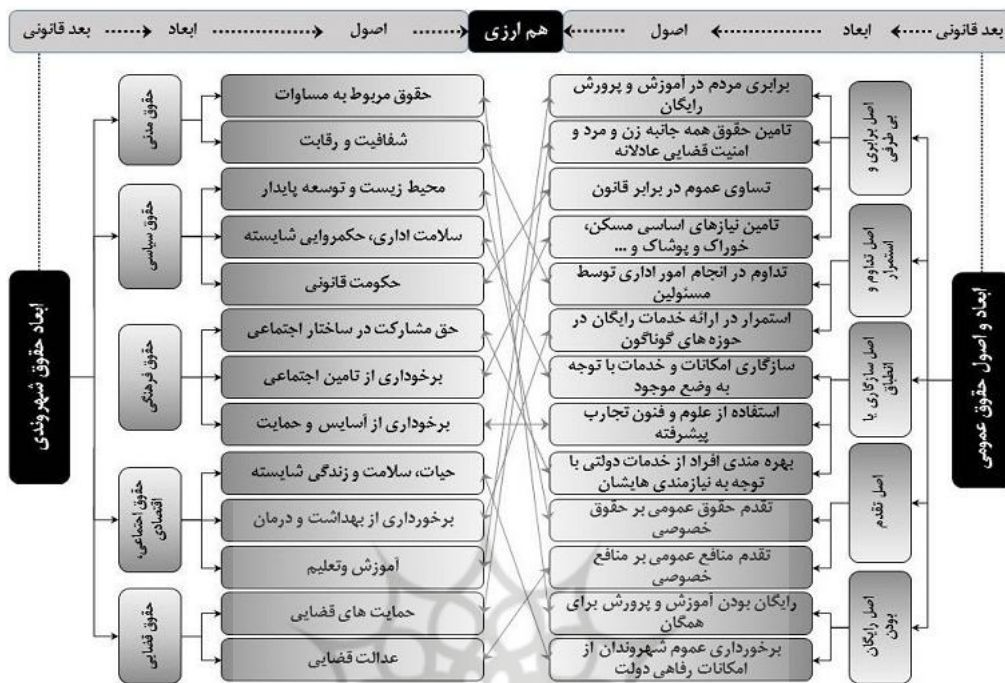
شکل (۴). ارتباط هم ارزی متقابل ابعاد حقوق عمومی و حقوق شهروندی

به‌طور عمده سه دیدگاه حقوقی-نظری در تبیین نسبت قانونی بین حقوق عمومی و حقوق خصوصی بیان می‌شود.