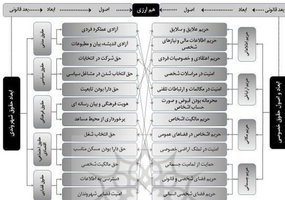
شکل (۲). ابعاد حقوق خصوصی و حقوق شهروندی