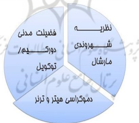
شکل (۳). انواع نظریات شهروندی

۳. آخرین سنت نظری شهروندی، مفاهیم جدیدی چون مردم‌سالاری، جنبش‌های اجتماعی، جامعه مدنی، ارتباط مردم سالارانه و کنش ارتباطی را مورد توجه قرار می‌دهد. این رهیافت جدید با توجه به تلاش صاحب‌نظرانی همچون «ترنر» و «هیتز» که مباحث شهروندی فرهنگی و شهروندی اجتماعی را مطرح کرده‌اند، در این مقوله تعریف می‌شود. باید اذعان کرد که رهیافت سوم بر اساس انتقادهای وارد به شهروندی دولت‌محور مارشال و فضیلت مدنی جامعه‌محور دورکیم شکل گرفته است (ربانی وراسگانی و کیانپور، ۱۳۸۶، ۱۳-۱۲) شکل (۳) و جدول (۲).