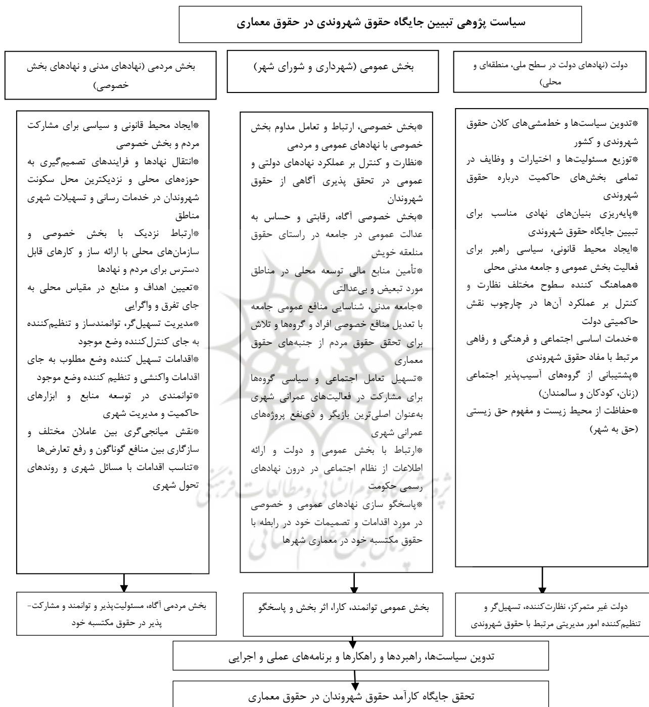
شکل (۶). سیاست پژوهی تحقق‌پذیری حقوق معماری