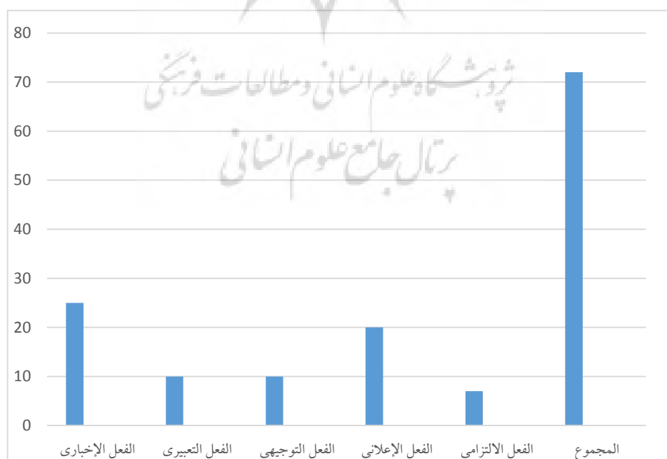
الرسم البياني لعدد الأفعال الكلامية في خطبتي ٢٧ و ٣٤