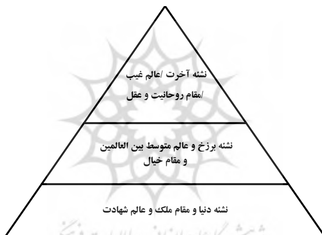
شکل (۱): سه نشئه، مقام و مرتبه انسان در دیدگاه امام خمینی

کمال یا طرف نقص. مثلاً اگر کسی قیام به وظایف عبادیه و مناسک ظاهریه، چنانچه باید و مطابق دستورات انبیاست، نمود، از این قیام به وظایف عبودیت تأثیراتی در قلب و روحش واقع شود که خلقتش رو به نیکویی و عقایدش رو به کمال گذارد. و همین طور اگر کسی مواظب تهذیب خلق و تحسین باطن شد، در دو نشئه دیگر مؤثر شود، چنانکه کمال ایمان و احکام عقاید تأثیر در دو مقام دیگر می‌نماید. و این از شدت ارتباطی است که بین مقامات است (امام خمینی ۱۳۷۶: ۳۸۷).