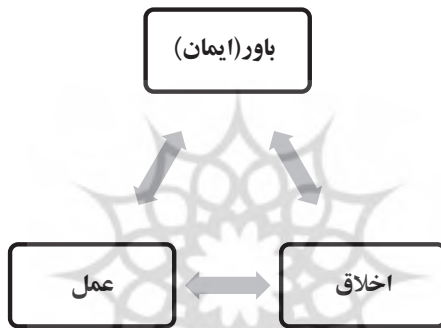
شکل شماره ۲: «ارتباط متقابل» مراتب (مؤلفه‌های) سه‌گانه وجود انسان

در شکل ۲، رابطه دوسویه میان هر یک از مراتب انسان (مؤلفه‌های وجود انسان) به‌خوبی نشان داده شده است: