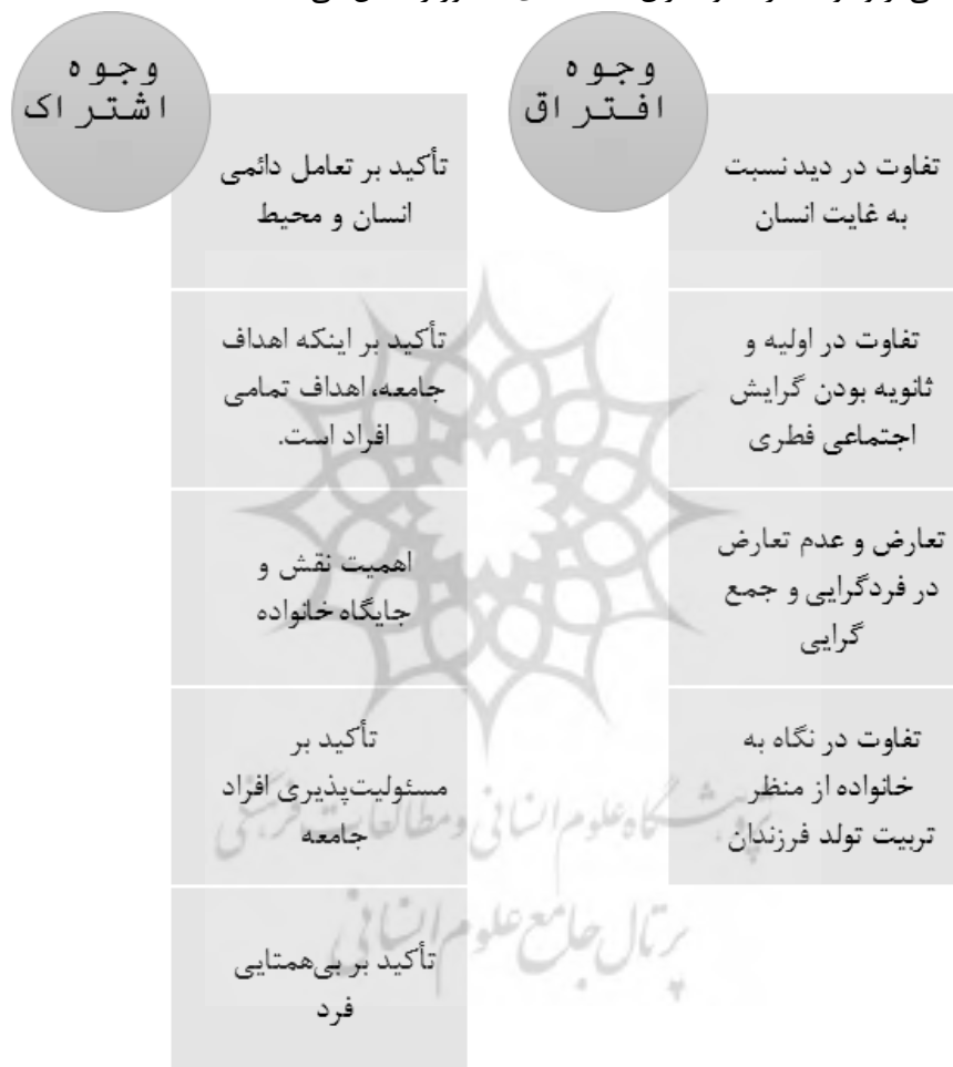
شکل (۴) وجوه اشتراک و افتراق رویکرد آدلری و مبانی جامعه‌شناختی تربیت رسمی و عمومی

- علی‌رغم آن که هر دو دیدگاه به اهمیت خانواده و چارچوب آن توجه خاصی نموده‌اند، ولی آدلر ترتیب تولد فرزندان خانواده را عامل مهمی در شکل‌گیری شخصیت افراد می‌داند؛ به گونه‌ای که از نظر وی فرزندان اول خانواده به احتمال زیادی در بزرگسالی بزهکار خواهند شد. در مبانی جامعه‌شناختی تربیت رسمی و عمومی سند تحول بنیادین، ترتیب تولد فرزندان مورد توجه قرار نگرفته است؛ و به صورت کلی نقش والدین را نسبت به تربیت فرزندان دارای جایگاهی والا می‌داند. شکل ۴ نقشه‌ای کلی از وجوه اشتراک و افتراق دیدگاه‌های مذکور را نشان می‌دهد: