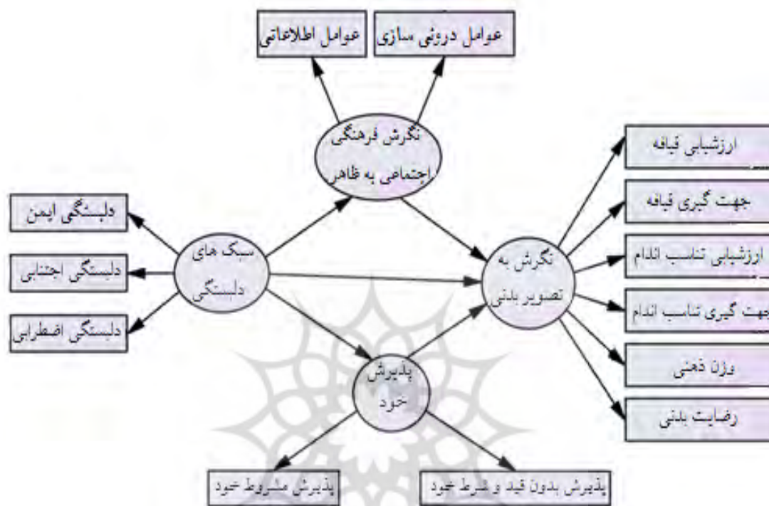
شکل ۱. مدل مفهومی پژوهش

پیام‌های بیشتری درباره ظاهر و اندامشان قرار می‌گیرند (فردریکسون و رابرتز، ۱۹۹۷) و همچنین رضایتمندی کمتر زنان از بدن خود نسبت به مردان (میلز و کامب، ۲۰۲۰) و اهمیت بیشتری که توجه به ظاهر در سنین نوجوانی پیدا می‌کند (سبزواری و همکاران، ۱۳۹۷)،