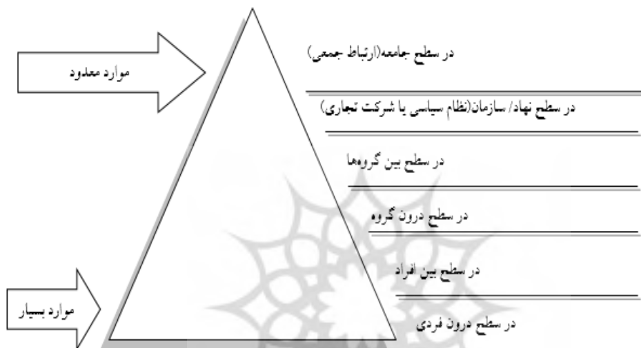
شکل ۲: سطوح ارتباطات به نقل از دنیس مک‌کوایل (۱۳۸۲: ۲۶)

قابل مطالعه است. دنیس مک‌کوایل نیز در کتاب خود با عنوان «درآمدی بر نظریه ارتباط جمعی» ۱ به شش سطح ارتباطی، مطابق با شکل ذیل پرداخته است: