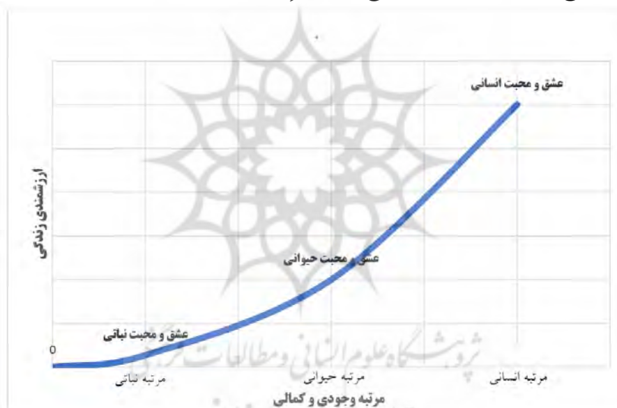
شکل ۱. نسبت «مرتبۀ وجودی انسان» با نوع و سطح «عشق»

محبت مؤلفه دیگری است که از منظر علامه جعفری در معنادهی به زندگی تأثیر دارد. ایشان در این باب بیانی دارد که بسیار ارزشمند است. طبق نظر ایشان، هر کس به مقدار و کیفیت شخصیتی که دارد می‌تواند محبت کند و عشق بورزد. شخصیت حیوانی چیزی جز محبت و عشق حیوانی تولید نمی‌کند؛ عشق و محبت انسانی به یک شخصیت انسانی نیازمند است. این اصل به عشق و محبت منحصر نیست، بلکه تمام شئون یک فرد، از حیث پوچ بودن یا با ارزش بودن، تابع شخصیت آن فرد است (جعفری ۱۳۹۵، ۳۸۹).