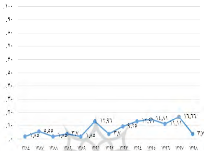
نمودار شماره (۱): زمان اجرای پیمایش مشارکت سیاسی در ایران