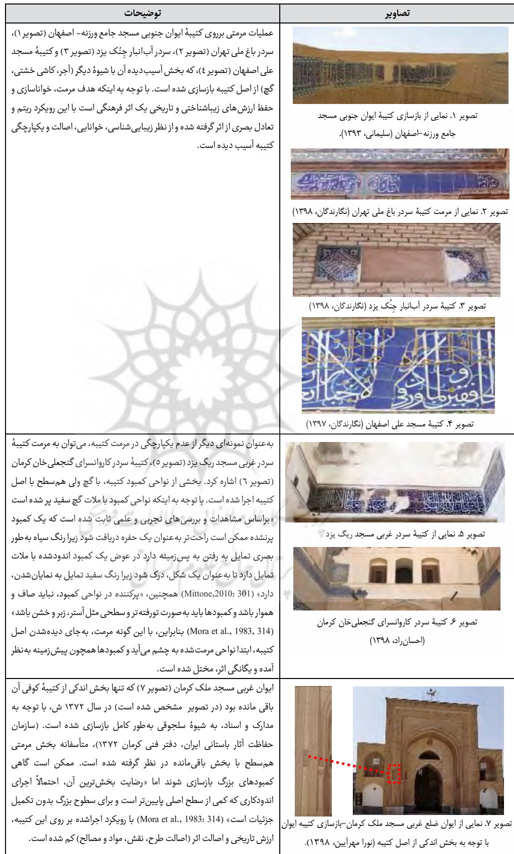
Tab. 1. Examples of restoration of inscriptions (Authors, 2019).