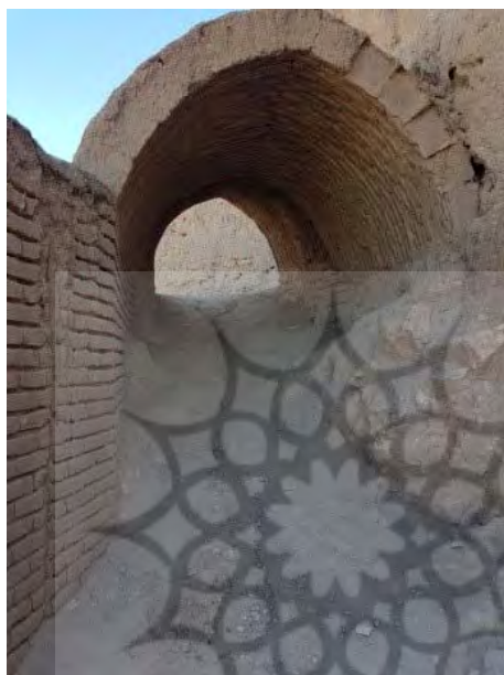
تصویر ۲. ورودی شمالی محوطه شرقی (نگارنده اول، ۱۳۹۹).

هستند (برای مقایسه ر. ک. به: Anisi, 2012: 197). ابعاد بیش از نیمی از خشت‌ها در ساختارهای معماری، بیش از ۳۰ سانتی‌متر و بقیه خشت‌ها کمتر از ۳۰ سانتی‌متر هستند. در بخش میانی قلعه دختر نیز بقایای معماری زیادی وجود دارد. اغلب این بناها روی صفا‌های مصنوعی خشتی ساخته شده‌اند و در قسمت جنوب آن، بارویی خشتی و یک برج برجای مانده است (تصویر ۵). با توجه به ارتفاع طبیعی در شمالی‌ترین قسمت از بخش میانی، احتمالاً ساختارهای معماری این بخش، بناهای حاکم‌نشین بوده‌اند. بخش‌های غربی ناحیه مرکزی قلعه دختر، از فضاهای وسیع و بدون ساختارهای معماری تشکیل شده که به عنوان محوطه باز کاربرد داشته است.