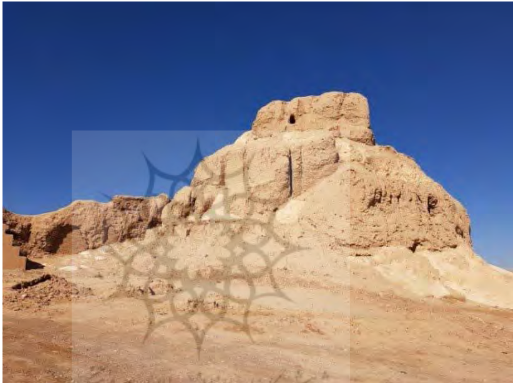
تصویر ۸. تختگاه آقامحمدخان یا برج توپر دیده‌بانی (نگارنده اول، ۱۳۹۹).

شواهدی از عناصر معماری خشتی در انتهای جنوب شرقی قلعه دختر روی صخره‌ای عظیم برجای مانده که درمیان اهالی شهر، با نام «تختگاه آقامحمدخان» شناخته می‌شود (تصویر ۸)؛ درحالی‌که براساس فرم معماری و مقایسه با برج توپر بخش شمال غربی به نظر می‌رسد، این عنصر نیز یک برج دیده‌بانی بوده که دید گسترده‌ای به نمای شهر داشته و بخش فوقانی آن فروریخته، اما بخش پایینی آن به صورت توپر باقی مانده است. در بدنه این سازه، روزنه‌های دیده‌بانی نیز وجود دارد. به نظر می‌رسد راه ارتباطی این سازه با بخش‌های دیگر، از طریق باروی قلعه دختر بوده است.