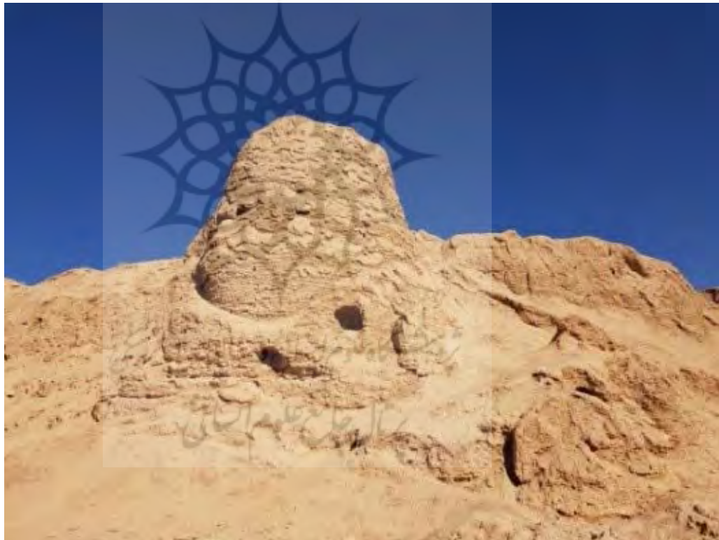
تصویر ۵. برج جنوبی بخش میانی قلعه دختر (نگارنده اول، ۱۳۹۹).