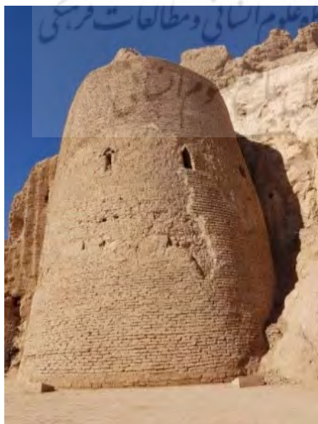
تصویر ۳. برج جنوبی در بخش شرقی (نگارنده اول، ۱۳۹۹).