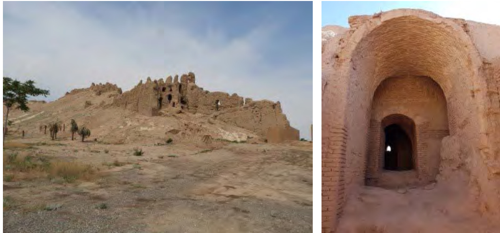
تصویر ۴. ساختارهای بخش شرقی قلعه دختر (نگارنده اول، ۱۳۹۹).