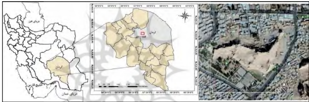
تصویر ۱. موقعیت جغرافیایی قلعه دختر در استان کرمان و ایران (عکس ماهواره‌ای از: Google Earth 2017؛ تنظیم از نگارنده اول، ۱۳۹۹).

قلعه دختر در یکی از محلات قدیمی شهر کرمان، بر روی صخره‌ای در شرق این شهر قرار دارد (تصویر ۱). طول جغرافیایی آن 40^{\circ} 57' ، عرض جغرافیایی آن 27^{\circ} 17' 30'' و ارتفاع آن از سطح دریا ۱۷۶۵ متر است. بلندترین نقطه قلعه دختر نسبت به سطح زمین‌های اطراف، ۶۰ متر اختلاف ارتفاع دارد. مساحت کلی قلعه دختر حدود ۱۰ هکتار است.