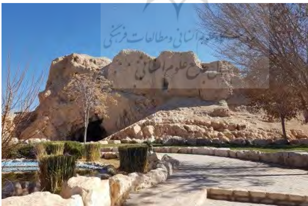
Fig. 6. Right: The Walker Gate, Left: The Rider Gate and The Tower at the Middle Part (The first Author, 2020).

تصویر ۷. بخش غربی قلعه دختر (نگارنده اول، ۱۳۹۹).