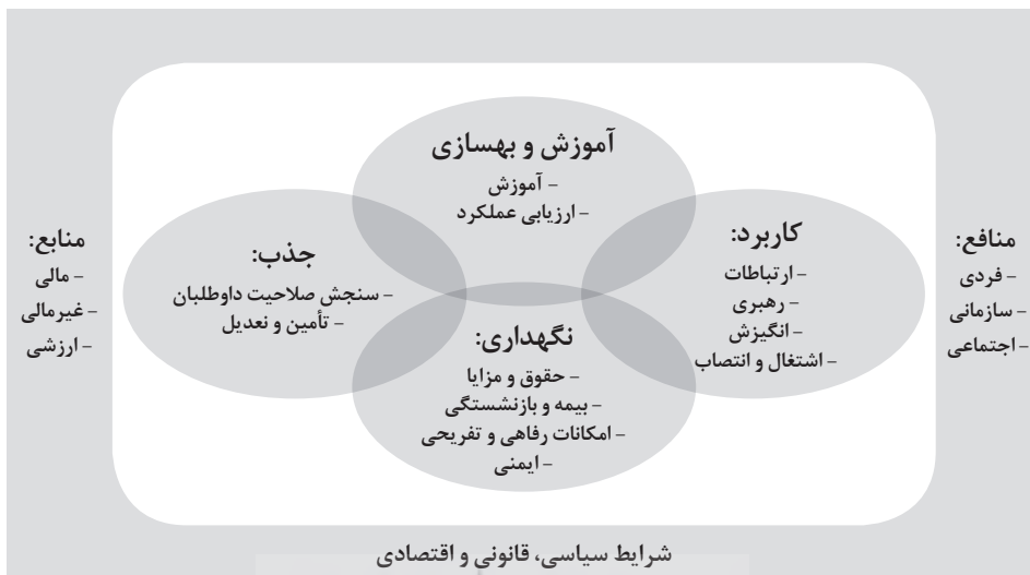
شکل ۱. مدل مفهومی پژوهش براساس مدل میر