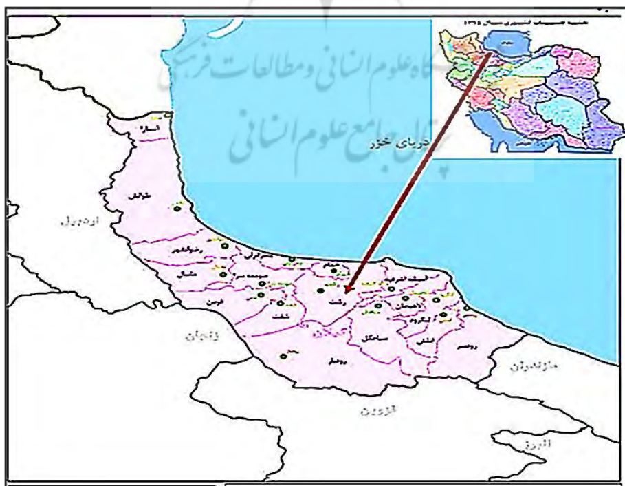
شکل ۲. جایگاه محدوده مورد مطالعه در سطح کشور، سامانه‌ی وزارت کشور: ۱۴۰۰