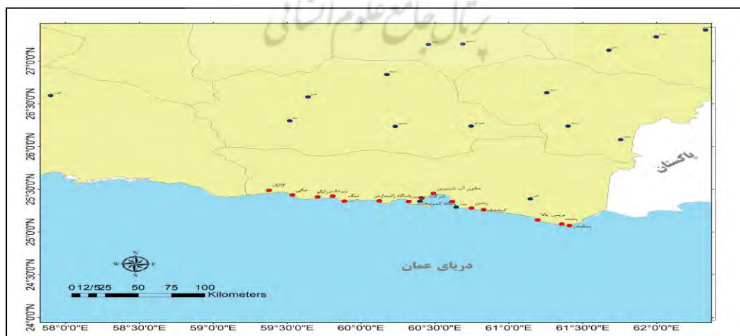
شکل ۱. موقعیت منطقه مورد مطالعه