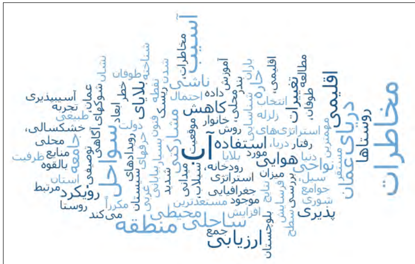
شکل ۳. ابرواژگان ارزیابی مخاطرات محیطی سواحل دریای عمان

مردم در منطقه آسیب پذیر بالقوه زندگی می کنند و شرایط اجتماعی مردم و ساختار کالبدی بافت های مسکونی، همچنین زیرساخت های حیاتی منطقه ساحلی چابهار در مناطق مورد سنجش، ضعیف می باشد. به همین ترتیب، ظرفیت با استفاده از چندین معیار به عنوان مثال وضعیت فعلی دولت در سطح محلی ارزیابی شد و ساختار سازمان های غیردولتی برای مدیریت بلایا نیز شناسایی گردید. وضعیت فعلی طرح آمادگی در برابر بلایا، قوانین صحیح و رعایت شده برای آمادگی در برابر بلایا، وضعیت تنوع گزینه های معیشتی در جوامع محلی، دولت های محلی موجود و سطوح منابع برای به حداقل رساندن خطر فاجعه، از دیگر متغیرهایی بود که مورد ارزیابی قرار گرفت (جدول ۱).