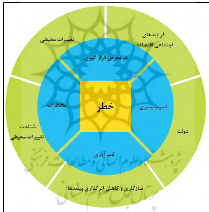
شکل ۲. مفهوم‌سازی آسیب‌پذیری برای آسیب‌پذیری منطقه‌ای

در اینجا ریسک (R) = احتمال عواقب مضر، ناشی از تعامل مخاطرات، عناصر آسیب‌پذیر و محیط است. خطر (H) = بالقوه، اما نه لزوماً، رویدادهای فیزیکی، پدیده‌ها یا فعالیت‌های انسانی آسیب‌رسان که ممکن است منجر به از دست‌دادن جان یا جراحت، آسیب به اموال، استرس اجتماعی و اقتصادی یا تخریب محیطی شود. آسیب‌پذیری (V) = ناتوانی در مقابله، مقاومت و بازیابی از خطرات. ظرفیت (C) = نقاط قوت و منابع موجود در یک جامعه یا سازمان که می‌تواند سطح خطر یا اثرات یک خطر را کاهش دهد.