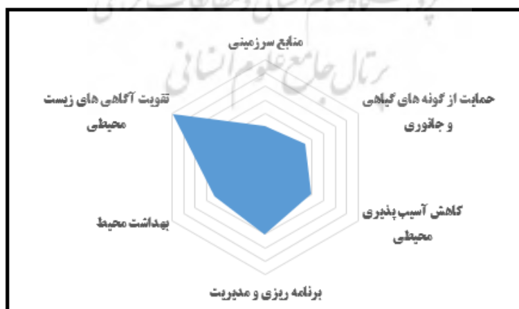
شکل ۴. تأثیرپذیری هر یک از مؤلفه‌های توسعه زیست‌محیطی از مدیریت مشارکتی