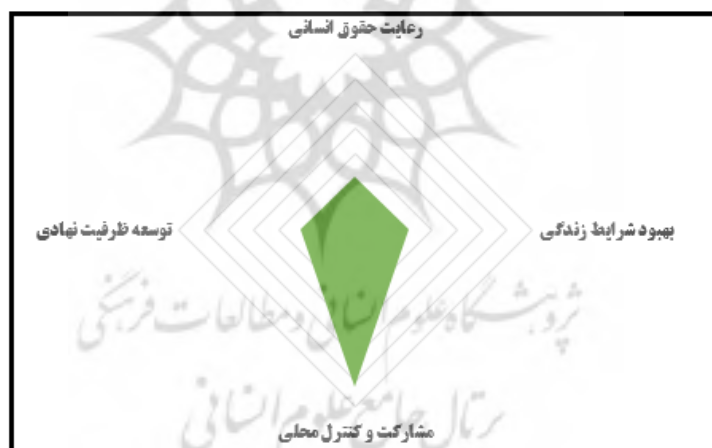
شکل ۲. تأثیرپذیری هر یک از مؤلفه‌های توسعه اجتماعی از مدیریت مشارکتی