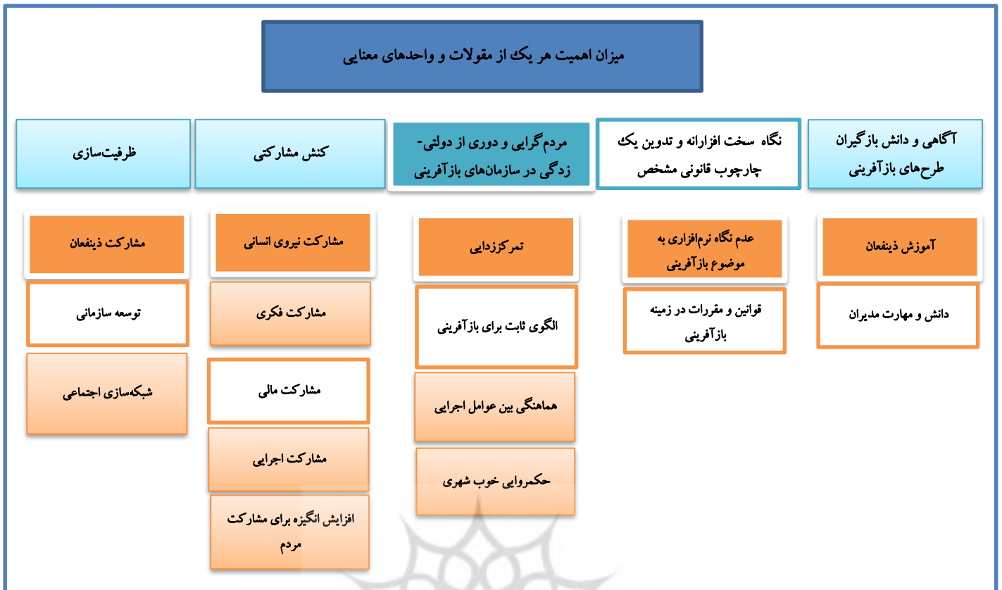
شکل ۲. مدل مفهومی اهمیت هر یک از مقولات و واحدهای معنایی