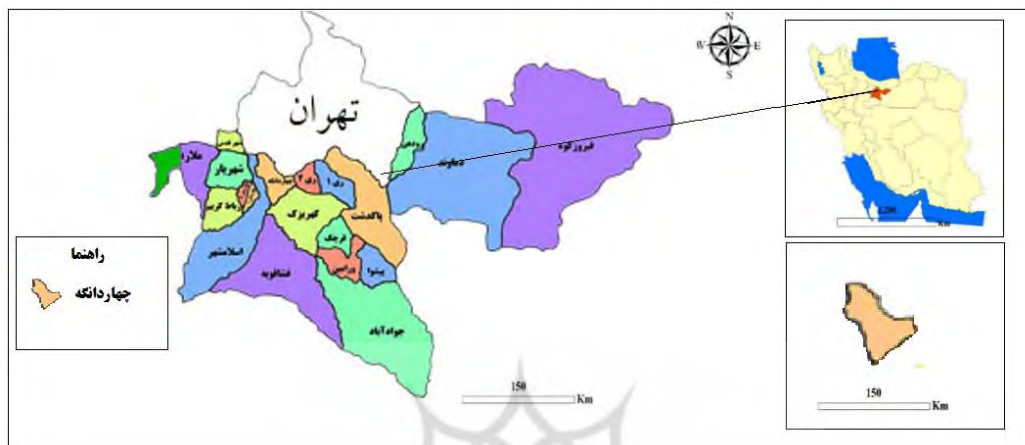
شکل ۱. موقعیت محدوده مورد مطالعه

و ورامین، از غرب به مرز غربی شهرستان‌های تهران، قدس، رباط کریم، شهریار (به استثنای دهستان جوقین) و کمر بند سبز حائل بین شهرهای تهران و گرمدره محدود است (طرح و کاوش، ۱۳۹۱، ۱۱۲). در نهایت ۲۶ شهر در گستره حریم قرار دارند (خندان و سبحانی، ۱۴۰۰)، که یکی از آن‌ها، چهاردانگه می‌باشد. چهاردانگه شهری است واقع در جنوب غرب تهران و شهرستان اسلامشهر است. جمعیت آن طبق سرشماری سال ۱۳۹۵، برابر با ۵۶۰۰۰ نفر می‌باشد. این شهر از سکونتگاه‌های چهاردانگه، مطهری، حسن آباد لقمانی، گلشهر، ماهشهر، حسین آباد مفرح در حریم استحقاقی جنوب تهران شکل گرفته است.