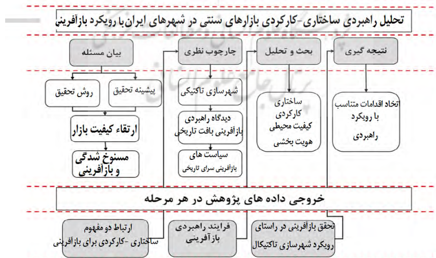
شکل شماره ۲. چارچوب مفهومی تحقیق

شهرسازی مبتنی بر تحولات ساختاری- کارکردی یک مفهوم کلی است که برای توصیف مجموعه‌ای از تغییرات موقت و کم‌هزینه در محیط ساخته شده استفاده می‌شود. این تغییرات عموماً در شهرها انجام می‌شود و هدف آن بهبود وضعیت محلات و مکان‌های عمومی است. از شهرسازی تاکتیkal با عناوین دیگری نظیر شهرسازی پاپ آپ، شهرسازی چریکی (نامنظم و آموزش ندیده)، تعمیر شهری، یا شهرسازی «خودت انجامش بده» ۱ یاد می‌شود (دیجی، ۱۳۹۰: ۴۲). به عبارتی دیگر، رویکرد تاکتیkal شامل انواع شیوه‌های ابتکاری است و استراتژی‌ها و پتانسیل طراحی شهری با استفاده از تأسیسات و امکانات موقت را بررسی می‌کند. برخی از این شیوه‌ها چند ساعت طول می‌کشد. در حالی که برخی از آن‌ها می‌توانند برای مطالعات گسترده‌ای که ممکن است تا یک سال ادامه یابند استفاده شوند. به‌طور کلی شهرسازی تاکتیkal را می‌توان رهیافت نوینی تعریف کرد که پایه و اساس آن مشارکت مردم است و استفاده از پروژه‌های کوتاه‌مدت و زودبازده از ویژگی‌های مهم آن است. شهرسازی تاکتیکی نیاز به در نظر گرفتن بعضی از اصول طراحی دارد تا بتواند فضاهای عمومی پُرجنب‌وجوش و پویا را ایجاد کند (اسمیت و همکاران، ۱۳۹۴ به نقل از زارع و همکاران، ۱۳۹۸: ۱۳۸).