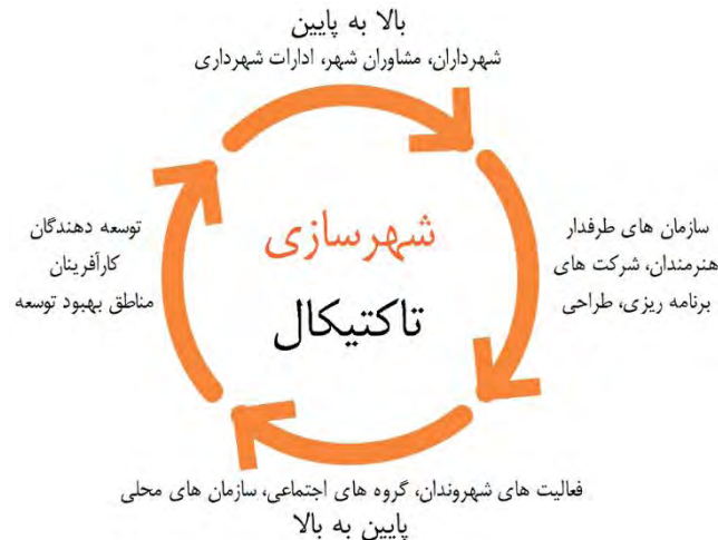
شکل شماره ۱. اصول و ابعاد شهرسازی تاکتیkal

شهرسازی مبتنی بر تحولات ساختاری- کارکردی یک مفهوم کلی است که برای توصیف مجموعه‌ای از تغییرات موقت و کم‌هزینه در محیط ساخته شده استفاده می‌شود. این تغییرات عموماً در شهرها انجام می‌شود و هدف آن بهبود وضعیت محلات و مکان‌های عمومی است. از شهرسازی تاکتیkal با عناوین دیگری نظیر شهرسازی پاپ آپ، شهرسازی چریکی (نامنظم و آموزش ندیده)، تعمیر شهری، یا شهرسازی «خودت انجامش بده» ۱ یاد می‌شود (دیجی، ۱۳۹۰: ۴۲). به عبارتی دیگر، رویکرد تاکتیkal شامل انواع شیوه‌های ابتکاری است و استراتژی‌ها و پتانسیل طراحی شهری با استفاده از تأسیسات و امکانات موقت را بررسی می‌کند. برخی از این شیوه‌ها چند ساعت طول می‌کشد. در حالی که برخی از آن‌ها می‌توانند برای مطالعات گسترده‌ای که ممکن است تا یک سال ادامه یابند استفاده شوند. به‌طور کلی شهرسازی تاکتیkal را می‌توان رهیافت نوینی تعریف کرد که پایه و اساس آن مشارکت مردم است و استفاده از پروژه‌های کوتاه‌مدت و زودبازده از ویژگی‌های مهم آن است. شهرسازی تاکتیکی نیاز به در نظر گرفتن بعضی از اصول طراحی دارد تا بتواند فضاهای عمومی پُرجنب‌وجوش و پویا را ایجاد کند (اسمیت و همکاران، ۱۳۹۴ به نقل از زارع و همکاران، ۱۳۹۸: ۱۳۸).