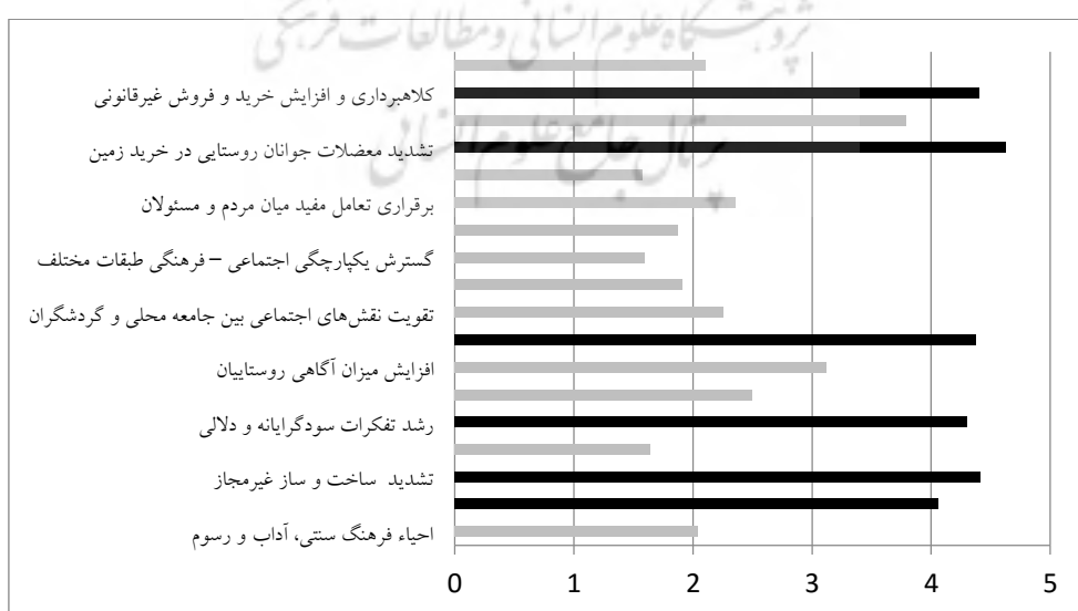
شکل ۳- میزان تاثیرات گردشگری در روستاهای مورد مطالعه