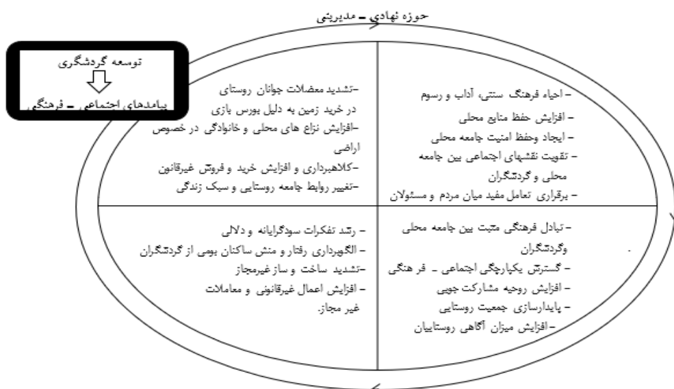
شکل ۱- مدل مفهومی پژوهش (منبع: نویسندگان، ۱۳۹۸)