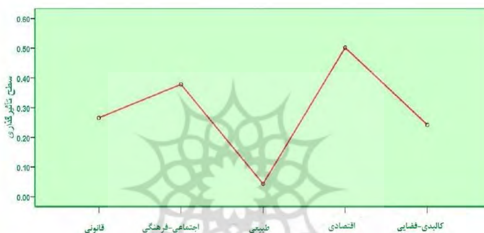
شکل (۳). مقایسه توان تاثیر گذاری عوامل مطرح در شدت تغییر کاربری اراضی کشاورزی و تبدیل آن به باغ ویلا در محدود مورد مطالعه