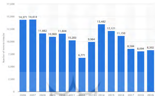
نمودار ۱. تعداد حوادث مرتبط با فعالیت‌های تروریستی در جهان

سال ۲۰۱۹ کاهش یافته و تلفات وابسته به این گروه‌ها از ۱۵۷۱ نفر به ۹۴۲ نفر رسیده است (GII, 2020). براساس آمار پایگاه اطلاعات جهانی تروریسم (۲۰۲۱)، تعداد فعالیت‌های تروریستی از سال ۲۰۰۶ تا ۲۰۱۹ در جهان متغیر بوده است.