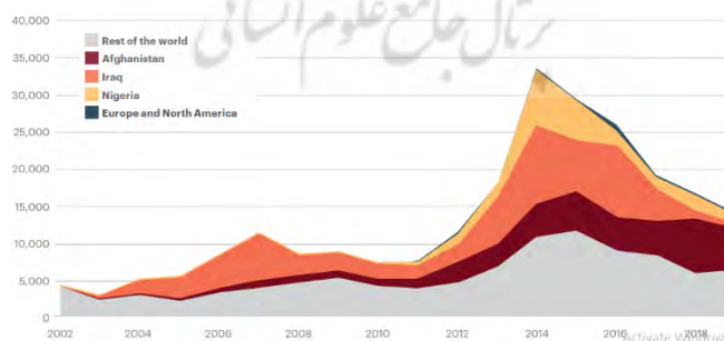
نمودار ۲. تعداد مرگ و میر ناشی از تروریسم ۲۰۰۲-۲۰۱۹ (start GTD, IEP calculation 2020)

همان‌طور که در نمودار (۱) نشان داده شده است؛ سال‌های ۲۰۰۶ و ۲۰۰۷ به ترتیب ۱۴۳۷۱ و ۱۴۴۱۴ حمله تروریستی را که بالاترین حد از حمله تروریستی در سطح جهان بوده را به خود اختصاص داده‌اند؛ پس از آن در سال ۲۰۱۲ عملیات تروریستی با ۶۷۷۱ حمله در سطح جهانی به پایین‌ترین سطح خود رسید. در سال ۲۰۱۴ تعداد عملیات تروریستی نسبت به سال ۲۰۱۲ بیش از دو برابر شد که نشان‌دهنده جهش بزرگی در تعداد فعالیت‌های تروریستی در جهان با ۱۳۴۸۲ حمله بوده که به‌طور عمده ناشی از افزایش اقدامات تروریستی در کشورهای غرب آسیا مانند عراق و سوریه بوده است.