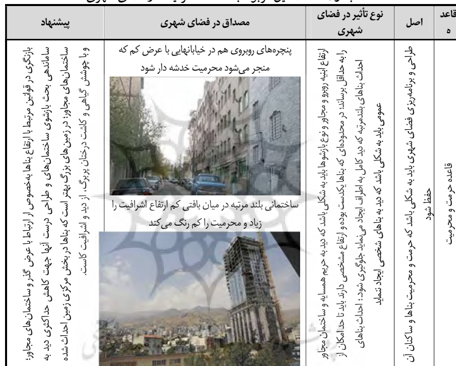
جدول ۴- مصادیق مربوط به قاعده محرمیت در فضای شهری

۳- قاعده فقهی تسلیط: این قاعده بیان می‌کند که انسان به اموال خویش تسلط داشته و کسی نمی‌تواند مزاحم این تسلط شده و در اموال دیگران بدون اذن و رضای مالک تصرف نماید. قاعده تسلیط که به قاعده تسلیط یا قاعده سلطنت نیز مشهور است بر اساس حدیثی از پیامبر مطرح می‌گردد: مردم بر اموال خویش مسلط هستند. «مفاد قاعده مرکب از دو جزء ایجابی و سلبی است: هر مالکی بر انواع تصرف‌ها در امور خویش مسلط است و هیچ شخص یا نهادی نمی‌تواند سلطنت وی را بر اموالش محدود سازد» (علیدوست و ابراهیمی راد، ۱۳۸۹، ص ۷). به عبارت دیگر به موجب