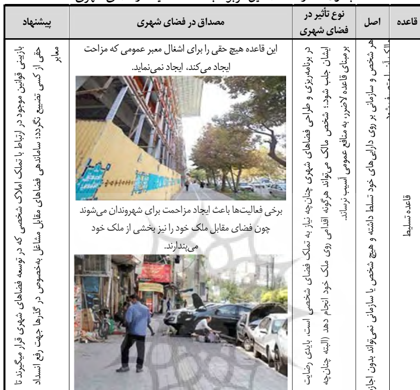
جدول شماره ۵- مصادیق مربوط به قاعده تسلیط در فضای شهری

۴- اصل یا قاعده لاضرر: در این قاعده بیان می شود که بایستی در استفاده از احکام، شرعیات، فضاها و... لاضرر و سهولت وجود داشته باشد؛ از این رو چنانچه از این قاعده در شهر استفاده کنیم مفهوم آن این خواهد بود که در ساماندهی و ساخت فضاهای شهری، بایستی سهولت در دسترسی و استفاده از فضاها مد نظر طراحان و برنامه ریزان قرار گیرد (عندلیب، ۱۳۹۷، ص ۸).