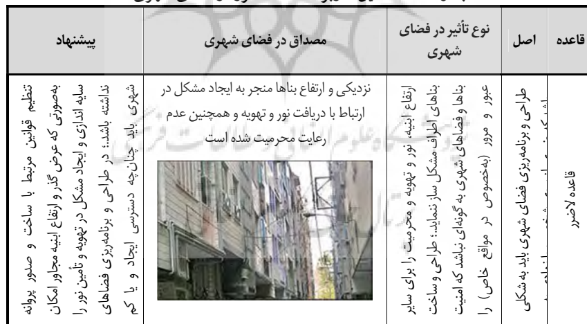
جدول ۳- مصادیق کاربرد قاعده لاضرر در فضای شهری

جنبه‌های مثبت، در بسیاری از موارد بلندمرتبه سازی باهدف صرفه‌جویی در مصرف زمین گران قیمت و سوداگری مورد توجه قرار می‌گیرد و این عمل غالباً منجر به شکستن حریم و کاهش محرمیت و ایجاد خرد اقلیم و سایه اندازی بر خانه‌های اطراف (عدم امکان استفاده از نور طبیعی مستقیم) و افزایش تراکم جمعیتی و آلودگی‌های زیست محیطی و ترافیک و تشدید خسارات ناشی از حوادث طبیعی و مصنوعی بر محدوده‌های همجوار می‌شود که به یقین بواسطه تأثیرات منفی بر کالبد و عملکرد شهر و منظر آن می‌تواند مصداق عبور از قاعده لاضرر باشد. همچنین در این قاعده فقهی بیان می‌شود که مدلول حدیث لاضرر و لاضرار بیان حکم تکلیفی حرمت وارد ساختن زیان ابتدائاً، یعنی نباید کسی به دیگری ضرر بزند و نیز حرمت مجازی دفع ضرر به وسیله ضرر است. به این معنی که مثلاً کسی مجاز نیست دیوار خانه دیگری را خراب کند، و اگر چنین کاری کرد، صاحب دیوار نباید برای مقابله دیوار خانه او را خراب کند (عبداللهی، ۱۳۹۸، ص ۵) لازم به ذکر است که در آیات ۲۳۱ و ۲۳۳ و ۲۸۴ سوره بقره و همچنین آیه ۱۲ سوره نساء و در احادیث منتسب به پیامبر گرامی اسلام ﷺ و امام صادق نیز به این قاعده اشاره شده است. جدول ذیل مصداق استفاده از قاعده لاضرر در فضای شهری را نشان می‌دهد.