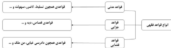
جدول ۲- قواعد فقهی مؤثر در برنامه‌ریزی و طراحی فضاهای شهری (برگرفته از قواعد مدنی)