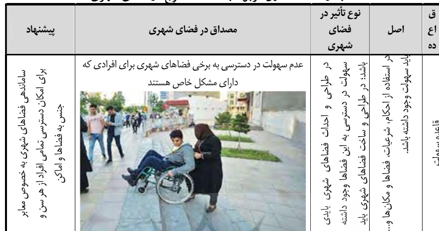
جدول ۶- مصادیق مربوط به قاعده لاجرح در فضای شهری

۱۷۳ ۵- اصل یا قاعده اتلاف: در این قاعده بیان می‌شود که اگر کسی باعث آسیب رسیدن به مال کسی شود باید آن را جبران نماید. همچنین بیان می‌شود هرکس بر شما تجاوزی نماید به مثل آنچه که انجام داده انجام دهید. تلف در اصطلاحی فقهی و حقوقی به معنای از بین رفتن عین مال یا منافع عقلایی و قانونی مال، خود به خود یا به موجب حوادث (اسدی، ۱۳۹۷، ص ۶). فقیهان در موارد مختلف جهت اثبات ضمان و مسئولیت مدنی به قاعده اتلاف تمسک جسته‌اند. ایشان این قاعده را با عبارت "من أَلَفَ مَالَ الْغَيْرِ فَهُوَ لَهْضَامِنَ" عنوان نموده و در اعتبار آن چنین گفته‌اند که اثبات این که اتلاف موجب ضمان است، نیازی به بیان ادله ندارد؛ همین که ضرورت و اجماع و نصوص فراوانی دلالت بر این می‌کند که مال، عمل و عرض و خون مسلمان محترم بوده و نمی‌توان به آن ضرر وارد کرد، بر قاعده دلالت دارد (انتظاری و محقق داماد، ۱۳۹۱، ص ۹).