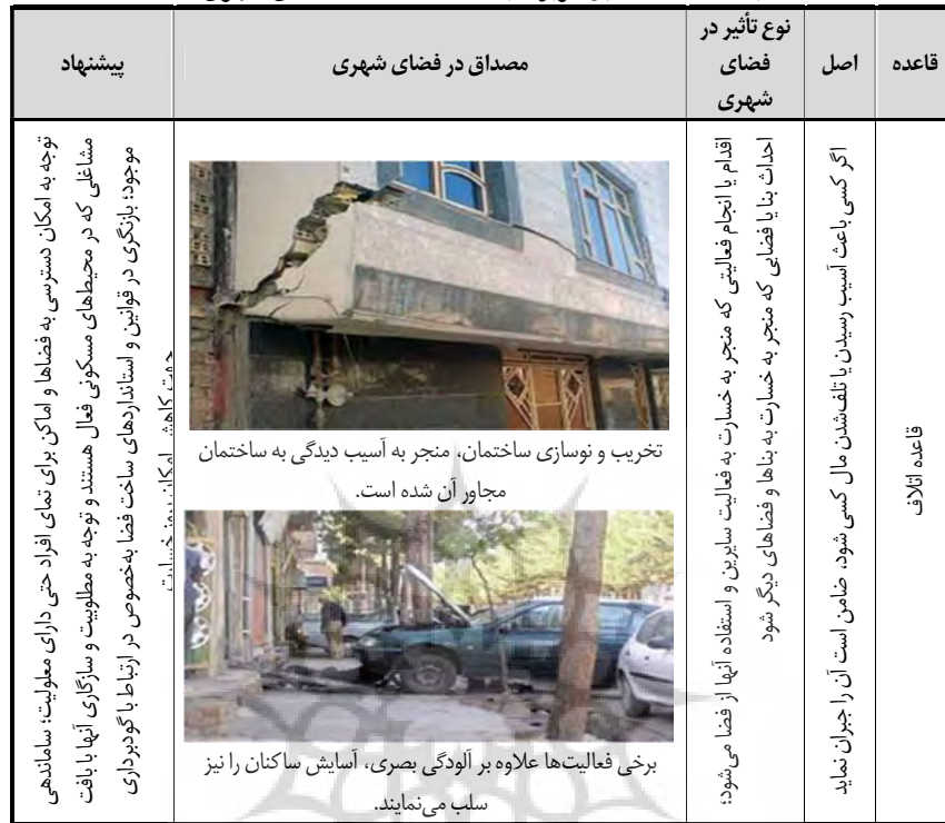
جدول ۷- مصادیق مربوط به قاعده اتلاف در فضای شهری