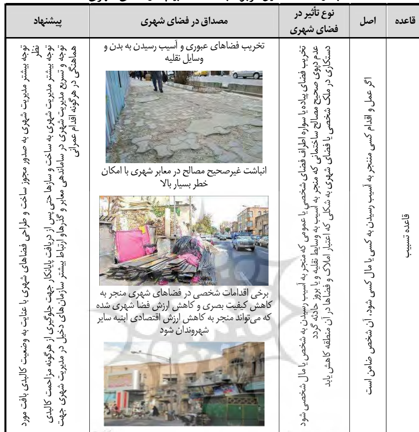
جدول ۸- مصادیق مربوط به قاعده تسبیب در فضای شهری

دو قاعده مهم معماری نیز می‌توانند در کنار این قواعد فقهی به مطلوب سازی فضاهای شهری کمک نمایند که به شرح ذیل می‌باشند؛ ۹- اصل وحدت و یکپارچگی: ساخت و ساز شهر باید به صورتی باشد که رعایت وحدت در اولویت قرار گیرد. یعنی ساماندهی روابط سلسله مراتبی فرم و عملکرد به سمت قلب شهر و نیز وضعیت اکولوژیک ساختمان‌ها با تأکید بیشتر بر نیازهای ویژه خانواده‌ها مورد توجه است (فیروزی و همکاران، ۱۳۹۶، ص ۷) در شهرسازی سنتی نیز موضوع حرکت از کثرت به وحدت نمایان بوده و در طراحی فضاها مورد تأکید بوده است. ساختار کالبدی و شکلی شهر در نگاه این قاعده باید به شکلی باشد که عناصر در کنار هم و در ارتباط با هم بوده تا بتوان در کنار کثرت عناصر در فضا،