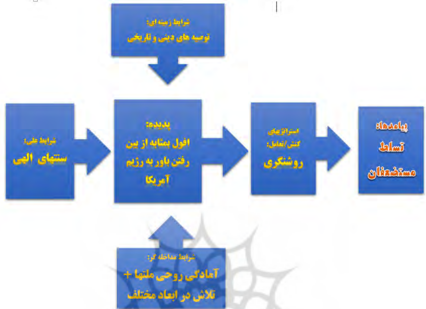
شکل ۲. مدل تبیین‌کننده افول آمریکا از نگاه آیت‌الله خامنه‌ای