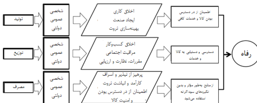
شکل ۱. مدل مفهومی مقاله «فلسفه و تأیید اعتبار عدالت رفاه در اقتصاد اسلامی»