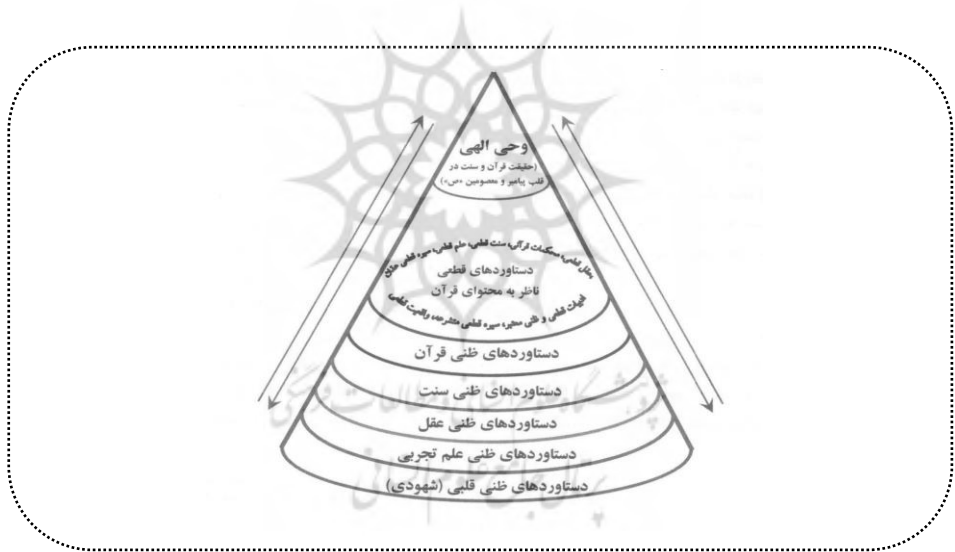
شکل ۱. نمودار مراحل معرفتی شش‌گانه

میان این مراحل رابطه‌ی رفت‌وبرگشتی است که در تصویر ذیل منعکس یافته است (نقی‌پورفر، ۱۳۹۸، ص ۱۱۴-۱۱۵).