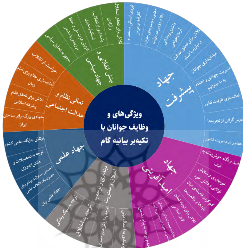
نمودار ۸ وظایف محوری جوانان در گام دوم انقلاب