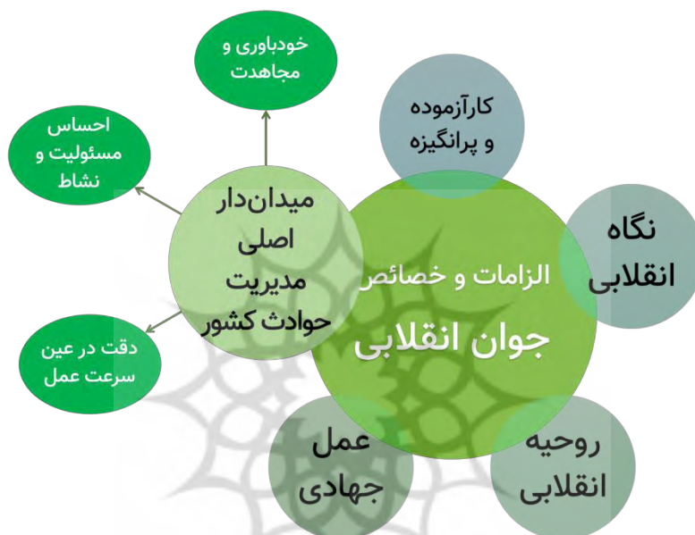
نمودار ۷. الزامات و خصایص جوان انقلابی در گام دوم انقلاب

«جوان انقلابی کارآزموده و پرانگیزه است؛ نگاه و روحیه انقلابی دارد و با عمل جهادی در حوادث و مسائل کشور میدان‌دار و در مرکزیت قرار دارد؛ لازمه عمل جوان انقلابی در حوادث کشور داشتن روحیه خودباوری و مجاهدت، احساس مسئولیت و نشاط و درعین حال دقت در عین عمل سریع است که در بیانه به‌درستی تصریح شده است.»