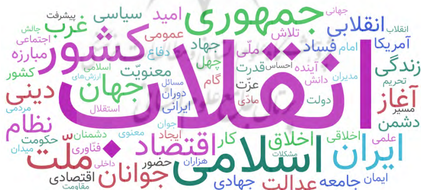
نمودار ۲. ابر کلمات پرتکرار بیانیه

برای اینکه بدانیم محتوای اصلی بیانیه در چه زمینه‌ای شکل گرفته می‌توان از ابر کلمات متن اصلی بیانیه بهره گرفت. استفاده از ابر کلمه می‌تواند نشان دهد که کلمات معنادار اصلی متن بیانیه چه عباراتی هستند. در ایجاد ابر کلمه از نرم‌افزار Orange Data Mining بهره گرفته شد و متن بیانیه در نرم‌افزار قرار گرفت تا ابر کلمه تشکیل گردد. لازم به ذکر است که کلمات اضافه و علامات نگارشی در ابر کلمه در نظر نگرفته شده است.