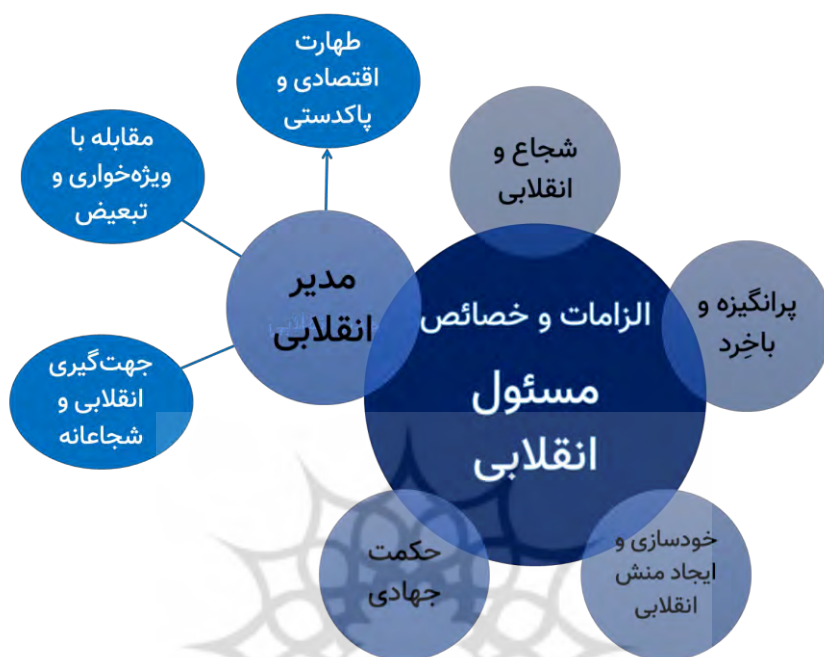
نمودار ۵. الزامات و خصائص مسئول انقلابی در گام دوم انقلاب