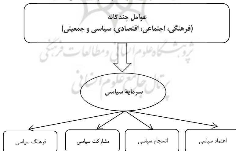
شکل شماره (۱). الگوی نظری سرمایه سیاسی

الگوی نظری پژوهش حاضر با تکیه بر مبانی نظری و مطالعات تجربی (پیشینه)، به شکل زیر ترسیم شده است.