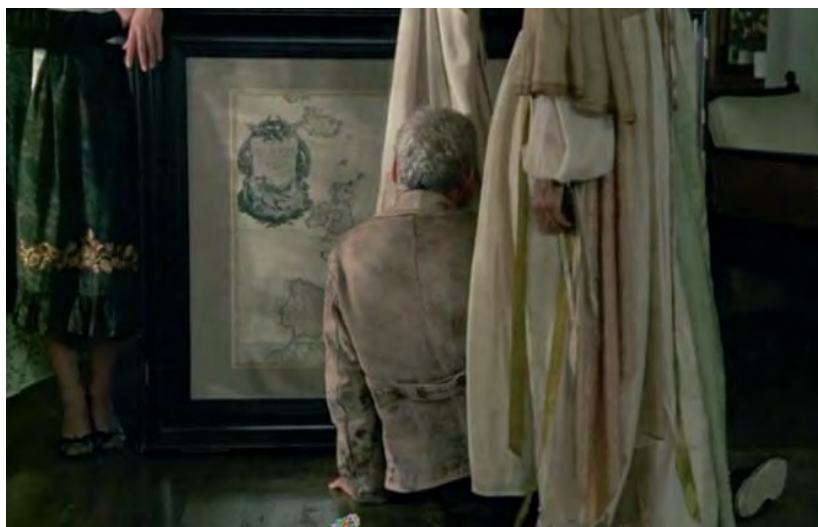
شکل ۵. ظواهر مانع دریافت حقیقت