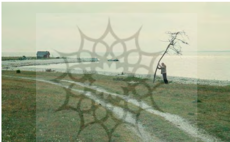
شکل ۲ و ۳. تصویر درخت خشک؛ همیشه برای رشد درخت؛ نور و آب و خاک کافی نیست