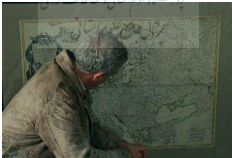
شکل ۴. هدیه مرشد به الکساندر؛ نقشه اروپای قرن ۱۷