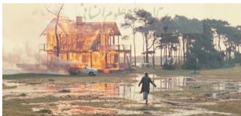
شکل ۷. به سوی آرامش؛ سکونت در جهان بیرونی محقق نمی‌شود