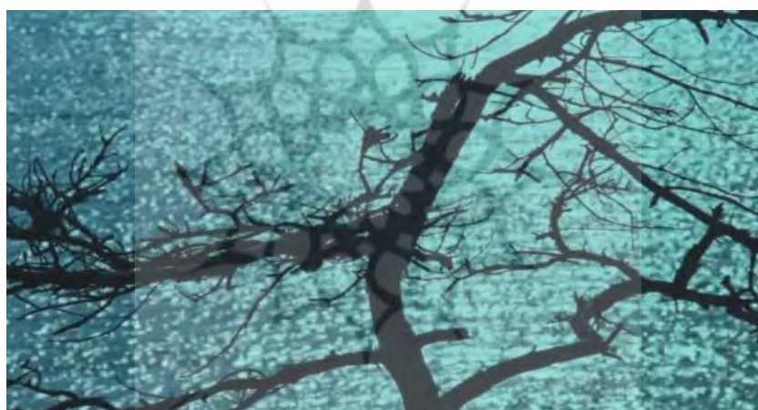
شکل ۶. سکانس پایانی فیلم ایثار