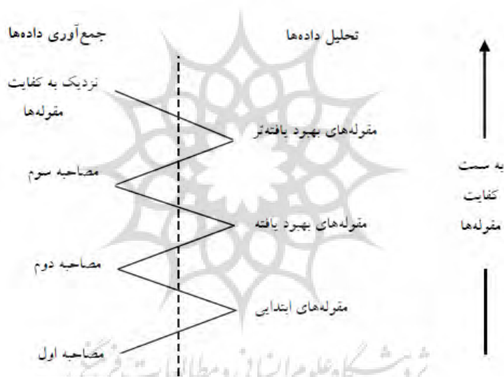
شکل ۱- فرایند حرکت زیگزاگی تا رسیدن به کفایت در نمونه‌گیری کیفی (محمدپور، ۱۳۹۸)

برای نمونه‌گیری از روش نمونه‌گیری گلوله برفی استفاده شده است. برای برآورد حجم نمونه فرایند نمونه‌گیری تا نقطه‌ای ادامه می‌یابد که اشباع نظری حاصل شود. بدین معناست که با انتخاب زیگزاگی مصاحبه شونده‌گان و سپس پیاده‌سازی و تحلیل بلافاصله آن‌ها این فرایند آنقدر تکرار می‌شود که یافته جدیدی به طبقات پیشین اضافه نشود. لذا پژوهش حاضر پس از ۱۳ مصاحبه به اشباع نظری رسید که همین تعداد به عنوان نمونه مطالعاتی مورد استفاده قرار گرفت (شکل ۱):