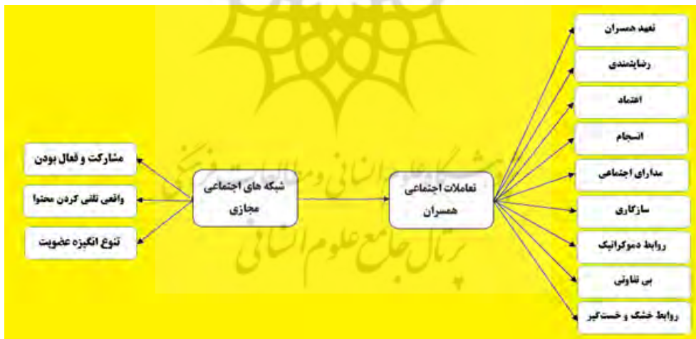
نمودار شماره (۱): مدل نظری تحقیق