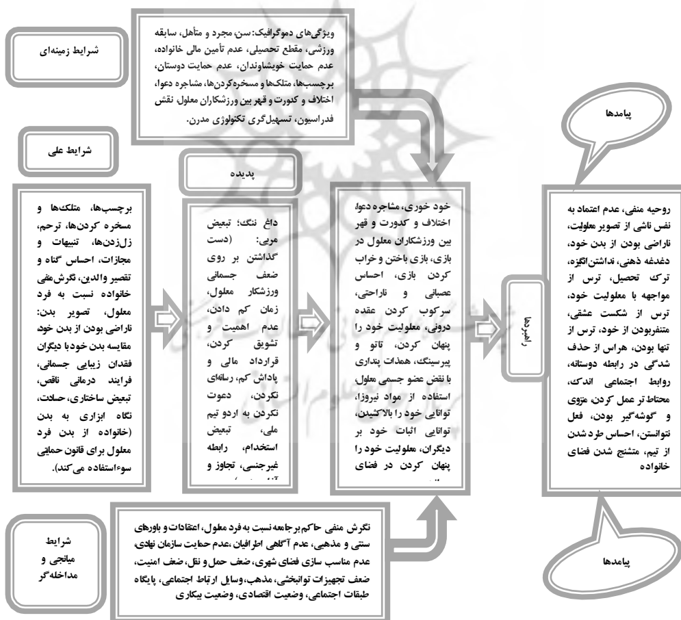
شکل شماره (۱): مدل پارادایمی داغ ننگ در ورزش معلولین