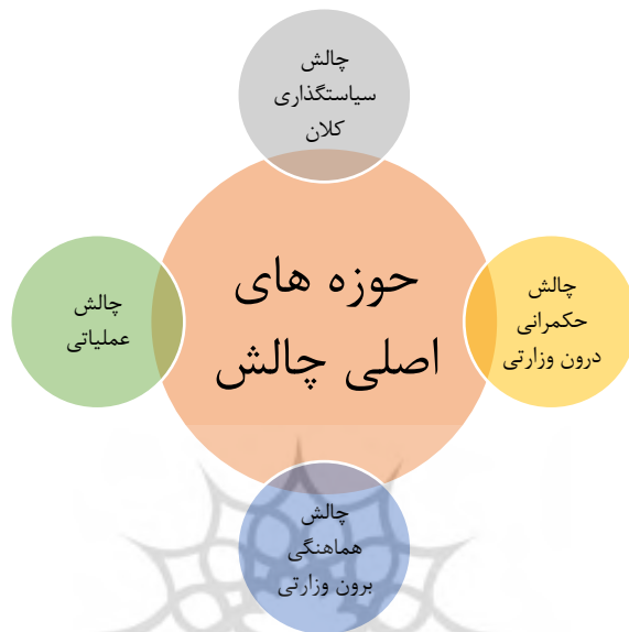
شکل شماره ۱: حوزه‌های اصلی چالش‌های مراکز مرجع همکاری‌های علمی بین‌المللی

در ذیل هر چالش اصلی مجموعه‌ای از زیرچالش‌ها شناسایی شد که بر اساس نظر صاحب‌نظران اولویت‌گذاری به شرح جدول ۲ صورت‌بندی شد.