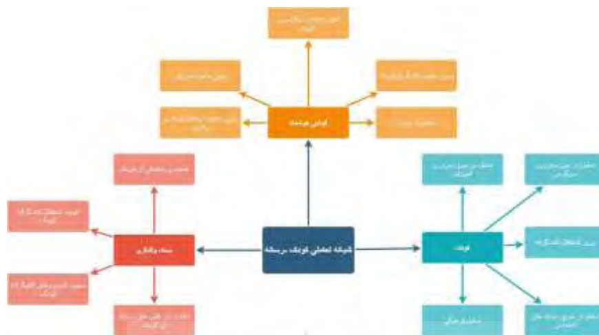
شکل ۲. شبکه مضامین