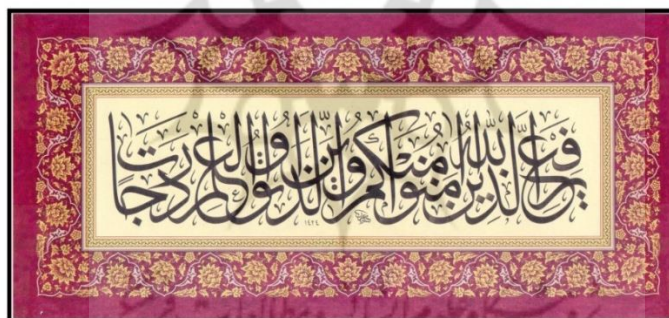
تصویر ۲-۱- نمونه کتیبه خوشنویسی ثلث، اثر محمد عثمان

«کتیبه‌ها انواع و کاربرد دیگری نیز دارند و در ذخیره سازی اطلاعات و انتقال افکار، اندیشه‌ها و تمدن بشری از نسل‌های گذشته به نسل حاضر نقش بسزا داشته‌اند. در هنر نسخه آرایی کتیبه شکل مستطیل گونه‌ای است که گاه در دو سوی آن دایره‌ها و ربع دایره کوچک کشیده باشند. مذهب‌ها از کتیبه‌ها در سردر سوره‌ها برای قرآن‌ها و سرفصل‌ها جهت دواوین [=دیوان‌های] اشعار و دیگر مکتوبات استفاده می‌کردند.