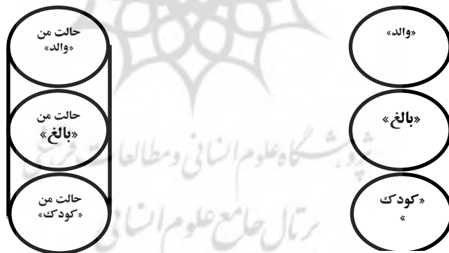
الف- نمودار ساختنی

با توجه به توضیحات بالا شکل شماره 1 را که نمودار ساخت نام دارد ارائه می‌گردد این طرح نمایانگر شخصیت کامل هر فرد، و شامل حالات من، «والد»، «بالغ» و «کودک» می‌باشد. این سه حالت کاملاً از یکدیگر مجزا نگه داشته شده‌اند، زیرا با یکدیگر بی-اندازه متفاوت و در اکثر مواقع متناقض هستند.