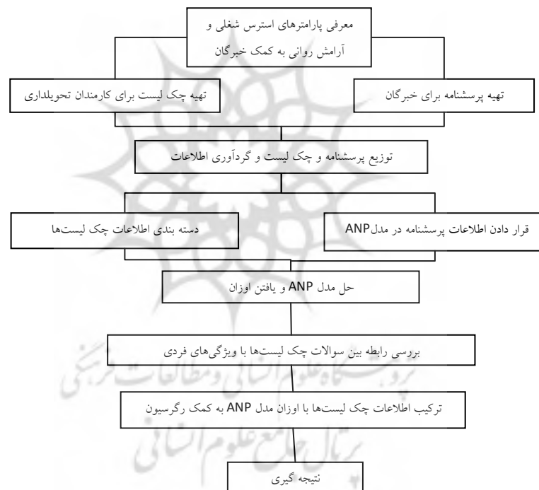
شکل ۱) الگوریتم مراحل انجام تحقیق

این تحقیق از نوع تحقیق‌های توصیفی - کاربردی علی معلولی بوده است که مراحل آن در شکل ۱ نشان داده شده است.