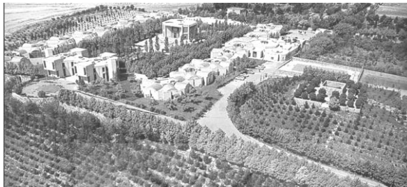
شکل ۳. دانشگاه امام صادق ع - تهران

نمونه شاخصی که از معماری سنت‌گرا در ایران می‌توان به آن اشاره نمود، طراحی و معماری ساختمان «مرکز مطالعات مدیریت» است که در بین سال‌های ۱۳۵۱-۱۳۵۴ بنا گردید که بعد از انقلاب، پذیرای دانشگاه امام صادق ع گردید. این اثر براساس معماری سنت‌گرایی که شامل دال مرکزی، بناهای با ارتفاع کم در اطراف و به صورت دایره‌وار و در نهایت کمربند سبز است، از جمله شاخص‌ترین اثراتی است که سنت‌گرایی در قالب معماری در ایران از خود برجای گذاشته است.