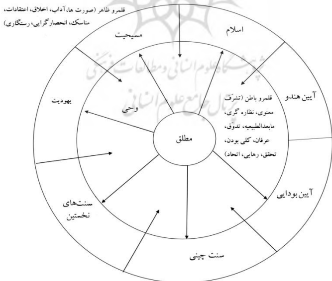
شکل ۲. رابطه ادیان با یکدیگر و با قلمروی باطن از منظر سنت‌گرایان

از نظر آنها حقیقت، واحد است و در سنت‌ها، آیین‌ها و حتی دین‌های مختلف تجلی پیدا کرده و همه، حتی آیین‌های بشری و بت‌پرستی مثل هندو نیز جزئی از این سنت هستند.