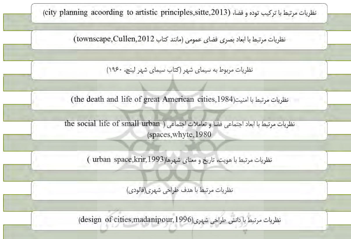
نمودار شماره (۲): گونه‌شناسی نظریات طراحی شهری معاصر

۲۰۰۰، ۲۰۰۴، مدنی پور (۱۹۹۶، ۲۰۰۶)، جیکوبز (۱۹۶۱) و غیره به طراحی شهری، در دو رویکرد جامع و بخشی، اشاره می‌کنند. در زمینه رویه‌ای نیز، چارچوب‌های نظری در دو حوزه درون رشته‌ای (کوان، ۱۳۸۵) و برون رشته‌ای (Lang, 2005; applyard, 1982) قابل طبقه‌بندی هستند: حوزه اول فرآیندهای طراحی شهری را از درون رشته تحلیل می‌کند و حوزه دوم بر ارتباط رشته - زمینه متمرکز شده است. مطالعات آرای صاحب‌نظران طراحی شهری در سال‌های اخیر، نشان می‌دهد که می‌توان این آرا را در گونه‌های مشخصی دسته‌بندی نمود. نمودار شماره ۳، نشانگر گونه‌شناسی نظریات مطرح شده در طراحی شهری معاصر می‌باشد.