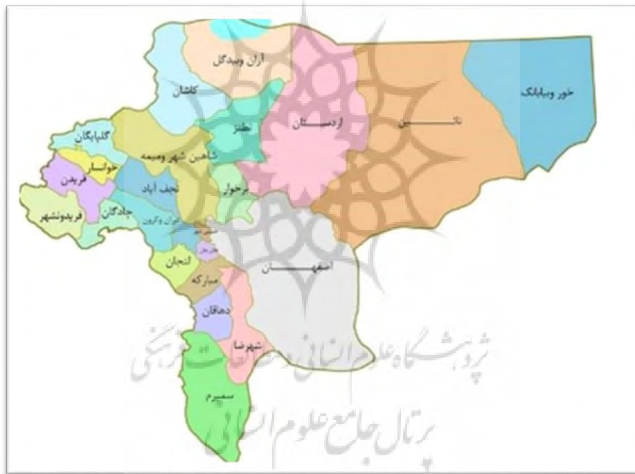
شکل شماره ۱: موقعیت شهرستان شاهین شهر و میمه در استان اصفهان

شهرستان شاهین شهر و میمه با وسعتی حدود ۶۱۰۵/۵ کیلومتر مربع در حد فاصل بین مدار ۵۴/۳۲ عرض شمالی از خط استوا و ۳۷/۵۱ طول شرقی از نصف النهار گرینویچ و در فاصله ۱۷ کیلومتری شهر اصفهان واقع شده است. جمعیت آن بالغ بر ۲۷۳ هزار نفر و شامل دو بخش مرکزی و میمه و شش شهر گز، گرگاب، شاهین شهر، میمه، وزوان و لایبید و ۴ دهستان و ۱۹ روستا می‌باشد. دهستان سه از جمله دو دهستان بخش مرکزی بوده که در منتهی‌الیه شمال شرقی شهرستان شاهین شهر و میمه قرار دارد. شکل‌های (۱ تا ۳) موقعیت شهرستان شاهین شهر و میمه، بخش مرکزی و دهستان سه را نشان می‌دهد.