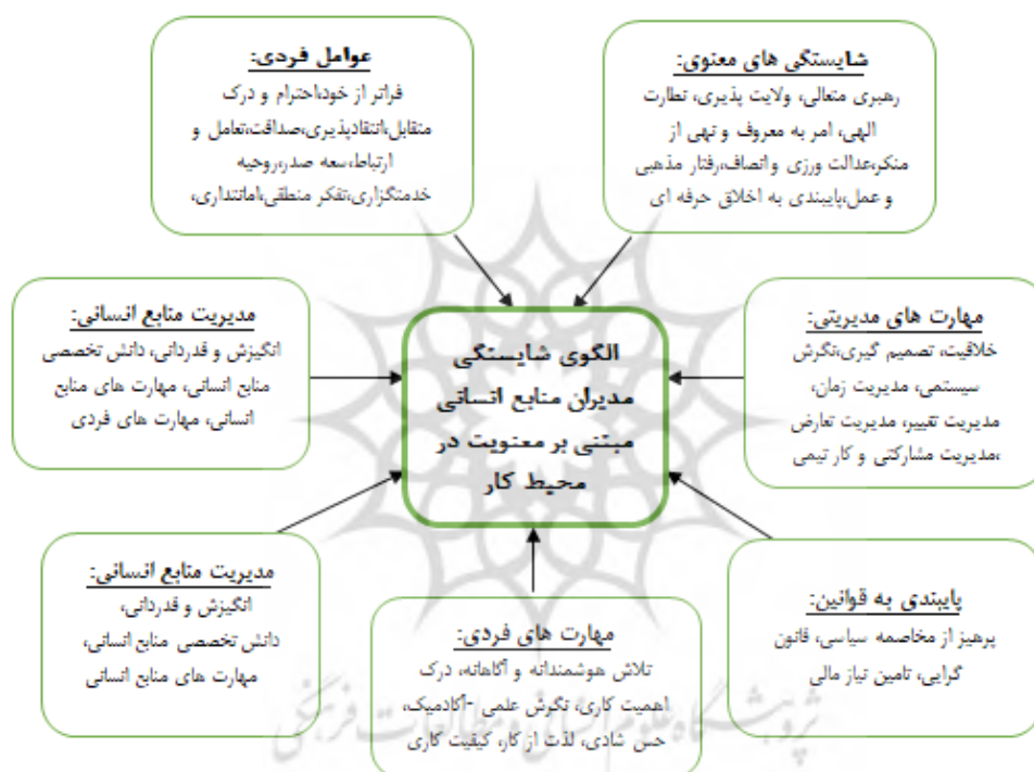
شکل ۱. مولفه‌ها و شاخص‌های پذیرفته شده در پژوهش

ترسیم مدل ساختاری - تفسیری: از نظر عادل آذر، پس از تعیین روابط و سطح متغیرها می‌توان آن‌ها را به شکل مدلی ترسیم کرد. به همین منظور ابتدا متغیرها، برحسب سطح آن‌ها به ترتیب از بالا به پایین تنظیم می‌شوند (۲). در پژوهش حاضر عوامل در چهار سطح قرار گرفته‌اند.