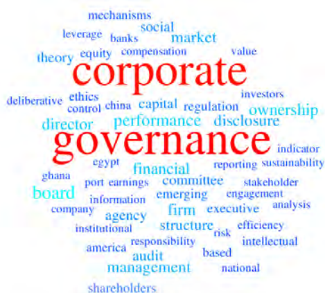
شکل ۲— نقشه علمی مبتنی بر فراوانی موضوعات با نمایش ابری