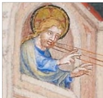
تصویر ۱۳. اشاره دست خدای پدر، بخشی از تصویر ۴

با توجه به جدول ۵ و با مقایسه دو جدول ۱ و ۳ مشخص می شود هنرمندان دو دین اسلام و مسیحیت در به تصویر کشیدن بشارت تولد عیسی (ع)، از عناصر تصویری مشترک و ثابت مریم و فرشته استفاده کرده اند. عناصر تصویری روح القدس، محراب، کتاب، کبوتر، گل سوسن و نور الهی مختص هنر مسیحیت و عناصر تصویری تسبیح و محل محرابی شکل، مختص هنر اسلامی هستند. همچنین در هنر مسیحیت، هنرمندان برای نشان دادن داستان معجزه آسای بشارت و تجسد، از عناصر سمبلیک در تصویر بهره گرفته و از سنت و روش های تفسیری قرون وسطی سود برده (Holmes, 1999: 232) و در اسلام، از روایات و متون تفسیری استفاده کرده اند. در کتاب انجیل و قرآن کریم مقصود از فرشته، جبرئیل است که به مریم (س) بشارت تولد عیسی را می دهد؛ در حالی که مقصود این دو دین مورد بحث، در مورد روح خدا متفاوت است. در انجیل، روح خداوند به کبوتر تشبیه شده و ترسیم روح خداوند در تصاویر مسیحی به صورت کبوتر است و این امر، نشان از رجوع نقاشان به متن انجیل و اعتقاد به باور تجسد دارد؛ در حالی که در اسلام و متون تفسیری مقصود از روح خداوند، یکی از فرشتگان مقرب و بزرگ (معمولاً جبرئیل) است که پیام آور خداوند است و این امر را می توان در نگارگری اسلامی نیز مشاهده کرد. در مسیحیت، روح القدس (روح خدا) سومین شخص تثلیث است. آنها معتقد