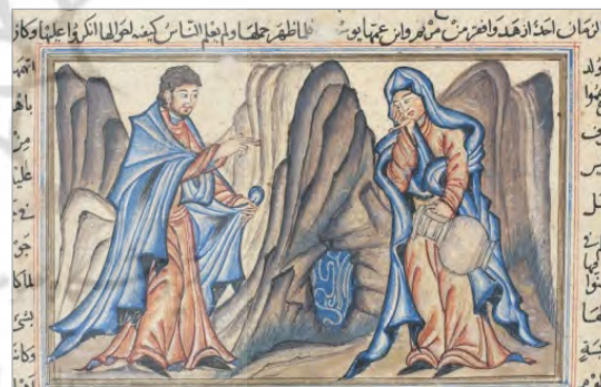
تصویر ۶ بشارت تولد عیسی، جامع‌التواریخ رشیدالدین، تبریز (ایلخانی)، سده ۸ ه.ق، دانشگاه ادینبورگ (URL: 6)

تصویر ۷، متعلق به آثارالباقیه بیرونی و محفوظ در کتابخانه دانشگاه ادینبورگ و تصویر ۸ نیز متعلق به آثارالباقیه بیرونی، محفوظ در کتابخانه ملی فرانسه است. در هر دو تصویر (۷ و ۸)، نگارگر برای ترسیم این موضوع، از طراحی قرینه‌وار اشخاص استفاده کرده و جبرئیل و مریم (س) را در دو مکان متفاوت ترسیم کرده است که اشاره به دو دنیای متفاوت آنها دارد. در این تصاویر، مریم (س) در سمت چپ، در مکانی محرابی شکل نشسته است و کتیبه‌ای به خط عربی بالای قوس قرار دارد. نگارگر با قرار دادن مریم (س) در این مکان، پاکدامنی او را به تصویر درآورده است. وی دوکی در دست دارد و در حال