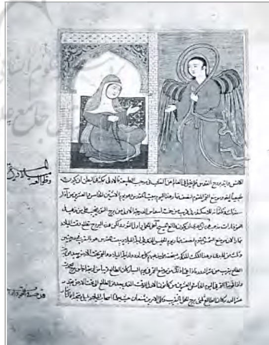
تصویر ۹. بشارت تولد عیسی، آثارالباقیه بیرونی، مثنی برداری از نسخه دوره ایلخانی، کتابخانه مدرسه عالی شهید مطهری (شایسته‌فر، ۱۳۸۶: ۳۸)