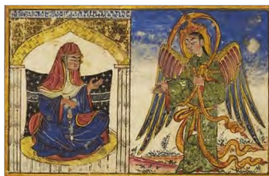
تصویر ۷. بشارت تولد عیسی، آثارالباقیه بیرونی، ایلخانی، ۷۰۷-۷۰۶ ه.ق، کتابخانه دانشگاه ادینبورگ (URL: 7)