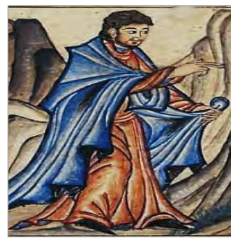
تصویر ۱۱. اشاره دست جبرئیل، بخشی از تصویر ۶