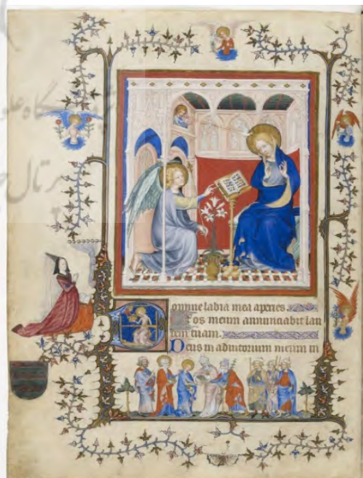
تصویر ۴. بشارت، استاد پرمنت، کتابخانه ملی فرانسه، پاریس، حدوداً ۱۴۲۰ (URL: 4)