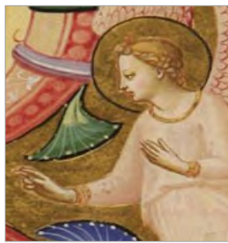
تصویر ۱۲. اشاره دست فرشته، بخشی از تصویر ۳