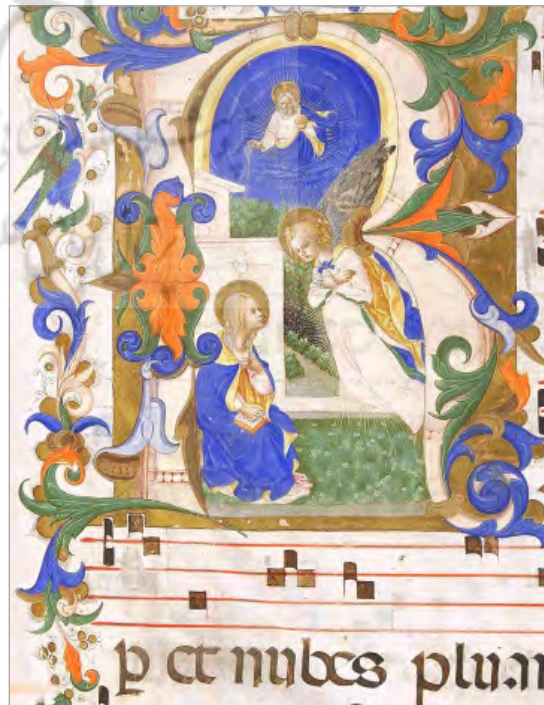
تصویر ۲. بشارت، زنوبی دی بندتو استروزی، موزه سن مارکو، فلورانس، قرن ۱۵ (URL: 2)