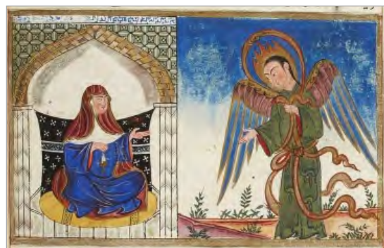
تصویر ۸. بشارت تولد عیسی، آثارالباقیه بیرونی، ایلخانی، مثنوی برداری از نسخه خطی ادینبورگ، کتابخانه ملی فرانسه (URL: 8)