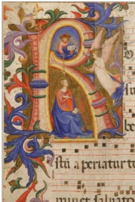
تصویر ۳. بشارت، فرا آنجلیکو، موزه سن مارکو، فلورانس، حدوداً ۱۴۲۵ (URL: 3)

نشانه احترام مقابل خود نگه داشته است. او نیز مانند خدای پدر با اشعه‌های نور احاطه شده است (تصویر ۲). فرا آنجلیکو یکی از هنرمندانی بود که موضوع بشارت تولد عیسی را ترسیم کرده است. این اثر او (تصویر ۳) با عنوان بشارت در موزه سن مارکو فلورانس نگهداری می‌شود. در این نگاره نیز همانند نگاره پیشین، موضوع بشارت در قاب مستطیل عمودی ترسیم شده است و بخشی از فضای صفحه به حرف R اختصاص دارد که با حلقه‌های رنگی، برگ‌های ساده، کنگره‌دار و نقوش تزئینی آراسته شده است. در قسمت بالایی حرف R، نقش خدای پدر به صورت نیم‌قد با هاله مقدس روی ابرها ترسیم شده است. او که با اشعه‌های نور احاطه شده، با دست راست خود به سوی مریم اشاره می‌کند و در دست چپ، کتابی باز به سمت روبه‌رو نگه داشته که در آن دو حرف بزرگ A, W نمایان است. مطابق متن انجیل، او روح‌القدس است که به صورت شیئی تابان با چهره انسانی نمایان شده و پرتوهای زرینی (نور الهی) از آن به همراه کبوتر سفیدرنگ به سوی مریم در حرکت هستند و با این کار، توجه را به سمت مریم جلب می‌کند. بدین ترتیب روح‌القدس، کبوتر را که پیام‌آور تولد است، به سوی مریم روانه می‌کند. در سمت راست تصویر، در فضایی که میان قاب مستطیل و حرف R وجود دارد، تصویر فرشته رو به سوی مریم با بال‌های برافراشته بر فراز ابرهای کوچک در حال پرواز مجسم شده