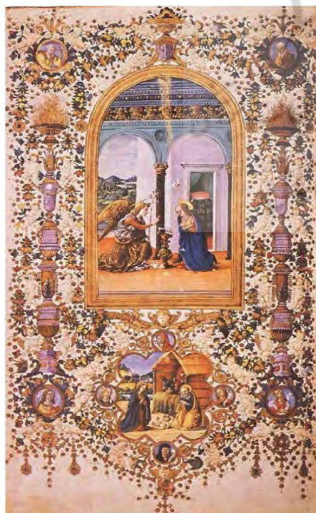
تصویر ۵. بشارت، فرانچسکو دی آنتونیو دل کیریکو، کتابخانه مدیسیین لاورنتین، ۱۴۵۸ (URL: 5)

است. او با دست راست خود همانند حالت دست خدای پدر، بشارت تولد عیسی را به مریم می‌دهد. در بخش پایین تصویر، مریم با هاله مقدس و ردایی بلند نشسته و کتابی باز روی پای او قرار دارد. او دستان خود را به نشانه احترام و پذیرش این مسئولیت الهی مقابل خود نگه داشته است. می‌توان در چهره او آرامش و پذیرش ناشی از این حکم الهی را مشاهده نمود. هنرمند برای هر یک از سه شخصیت اصلی، فضایی را در نظر گرفته و هر یک از این فضاها از دیگری مجزا هستند. استاد پرمنت ۸ یکی دیگر از هنرمندانی بود که عید تبشیر را ترسیم کرده است. اثر او با عنوان بشارت حدوداً متعلق به سال ۱۴۲۰ است و در کتابخانه ملی فرانسه در بخش نسخه‌های خطی به شماره ms. NAL 3039 نگهداری می‌شود. این نگاره، برگی از کتاب مذهبی ساعت است. نگاره در یک قاب مستطیل عمودی ترسیم شده است. در این تصویر هنرمند، فضای داخل بنا را مکان این میعادگاه در نظر گرفته و صحنه این رویداد، با ستون و قوس‌های محرابی زینت یافته است. فرشته در سمت چپ، با هاله تقدس و بال‌هایی جمع‌شده، در محراب مقابل مریم زانو زده است. او در حالی که در دست چپ خود عصایی نگه داشته، با دست راست اشاره به مریم می‌کند و با این حرکت، نوید تولد مسیح را می‌دهد. در سمت راست، مریم در کنار محراب نشسته و کتابی در