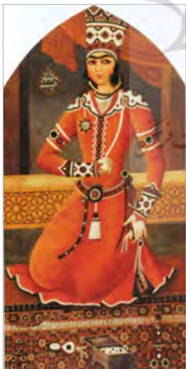
تصویر ۲. همان تصویر پیشین است، با این تفاوت که نگارندگان، صورت یکی از نقاشی‌های پرتره «رامشگران» میرزا بابا را به شکل دیجیتال جایگزین صورت «شاهزاده یحیی» کرده و شمشیر و خنجر را نیز از تصویر حذف کرده‌اند (نگارندگان)

ویژگی‌ها و زیبایی تن مرد و زن استفاده شده است. «در نوشته‌های پیشامدرن ایرانی، مرد جوان، زیبایی مطلق بود. در واقع، اغلب این زن جوان بود که به زیبایی ایده‌آل مرد جوان نزدیک می‌شد» (نجم‌آبادی، ۱۳۹۶: ۱۰۴). از نظر احسان یارشاطر، پیشینه زیبایی ایده‌آل مرد جوان، که به‌وفور در شعر فارسی دیده می‌شود، به ترکانی می‌رسد که «برای خدمت لشکری از ترکستان به ایران می‌آمدند و غالباً در دربار امرای سامانی و غزنوی و سلجوقی و دیگران پراکنده بودند و مورد نیاز عاشقانه صاحب‌دلان قرار می‌گرفتند، تا آنجا که «ترک» در زبان فارسی مرادف معشوق به شمار آمد» (یارشاطر، ۱۳۸۳: ۱۵۳). دل‌بستگی محمود غزنوی به «ایاز»، مصداق بارز آن است و در ادبیات نیز مثنوی «گوی و چوگان»، شرح ماجرای عشق درویش و شاهزاده‌ای است. همچنین در مثنوی «دستورالعشاق» نیز محور داستان، همین ماجراست؛ سنتی که تنها محدود به آن دوران نماند، تا جایی که برخی محققان ادب فارسی این عشق‌ورزی را در ادبیات نکوهش کرده‌اند. برای مثال، شبلی نعمانی می‌نویسد: «این قضیه اشعار عشق و عاشقی، چهره ایران را که قشنگ‌ترین و لطیف‌ترین و حساس‌ترین اشعار روی زمین را دارد، واقعاً مخدوش ساخته است» (نعمانی، ۱۳۹۵: ۱۳۲).