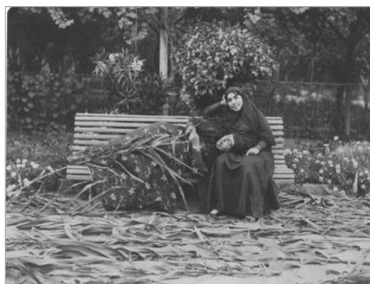
تصویر ۱۳. انیس الدوله و دختر او، عکاس: احتمالاً دوستعلی خان معیرالممالک، ۱۸۷۵ م. از مجموعه دنیای زنان در عصر قاجار (URL: 3)