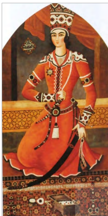
تصویر ۱. شاهزاده یحیی، منسوب به محمدحسن، حدود ۱۸۳۰، موزه بروکلین، (Diba & Ekhtiar, 1998: 195)