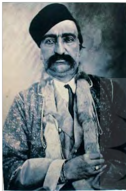
تصویر ۵. ناصرالدین‌شاه، خودنگاره، بین سال‌های ۱۲۹۵ تا ۱۲۹۷ ق. (سمسار و سرایبان، ۱۳۸۲: ۱۴۲)

درباری و غیردرباری در حالات و موقعیت‌های گوناگون گرفته است، عناصری درون قاب عکس ثبت شده که هیچ‌گاه در نقاشی‌ها دیده نمی‌شدند. در این عکس‌ها حتی مفهوم قدرت مردسالارانه، که مفهومی اساسی در کلیشه‌های جنسیتی دربار فتحعلی‌شاه بود، کاملاً دگرگون شده است. مفهوم مردانگی و قدرت که در پرده سلام نوروزی فتحعلی‌شاه دیده می‌شود (تصویر ۶) با عکسی که ناصرالدین‌شاه با زنان خود گرفته،