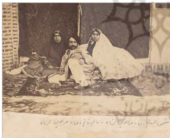
تصویر ۷. ناصرالدین‌شاه در کنار دو تن از زنان خود، عکاس: ناصرالدین‌شاه، حدود ۱۸۷۰ م. (سمسار و سراییان، ۱۳۸۲: ۳۱۱)

به بیان سارکوفسکی، عکاسی، "زمان‌مدارترین" رسانه است. عکاسی زمان‌مند است و «با موضوعی در زمان حال سروکار دارد» (Szarkowski, 2007: 100). در پیکرنگاری‌ها، تصویری که از زنانگی و مردانگی بازنمایی می‌شد، فارغ از زمان و محیط اجتماعی آنان بود، ولی عکاسی "اینجا و اکنون" را روایت می‌کند؛ در نتیجه، واقعیت آرمانی پیشین بی‌زمان را یکسره در هم می‌ریزد. در درک گفتمان جنسیت دوره ناصری، مسئله زمان همانند گزاره‌های قبل، با مفهوم آرمانی از نقش‌های جنسیتی تابلوهای نقاشی پیوند نمی‌خورد، زمان‌مندی عکس اجازه نمی‌دهد تا دختران لوند و دیده‌نواز پیکرنگاری‌های درباری موضوعیت پیدا کنند، زمان‌مندی گزینشی عمل نمی‌کند و عکس در قالب واقعی خود به دور از هر نوع جذبه تصنعی، جنسیت را بازتعریف می‌کند. از این‌رو در عکاسی این دوران، مطابق گفتمان مسلط تاریخی این روزگار، زنان بیشتر موجوداتی خانگی و آسیب‌پذیر به نظر می‌رسند و در مقابل، مردان در محیط‌هایی خارج از