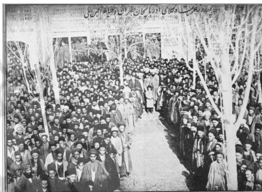
تصویر ۹. وکلای آذربایجان هنگام عزیمت به تهران، عکاس ناشناس، حدود ۱۲۹۰ (افشار، ۱۳۷۰: ۱۱۴)