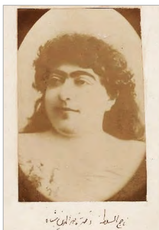
تصویر ۱۴. تاج السلطنه، عکاس ناشناس، ۱۸۹۵، از مجموعه دنیای زنان در عصر قاجار (URL: 3)