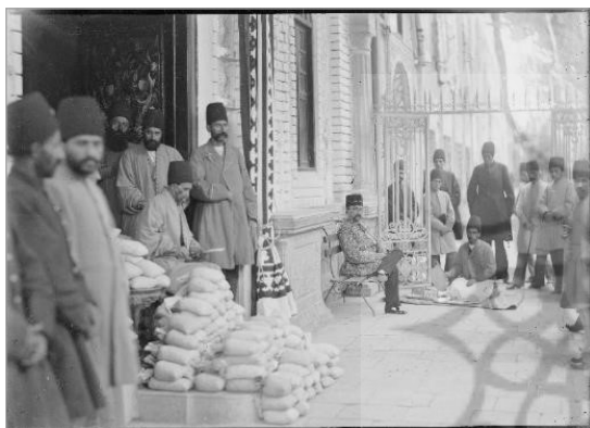
تصویر ۱۰. آنتوان سوریوگین، ناصرالدین‌شاه و عمله دربار، حدود ۱۸۸۲، موزه اسمیتسونین (URL: 1)

در نقاشی از ناصرالدین میرزای نوجوان (تصویر ۱۲)، همچنان مقاوت معیارهای بازنمایی سنتی را می‌توان دید؛ چهره‌ای با زیبایی مثالی زنانه، کمر باریک و بی‌زمان. وقتی این نقاشی را در کنار دیگر نقاشی که از او، تقریباً در همان