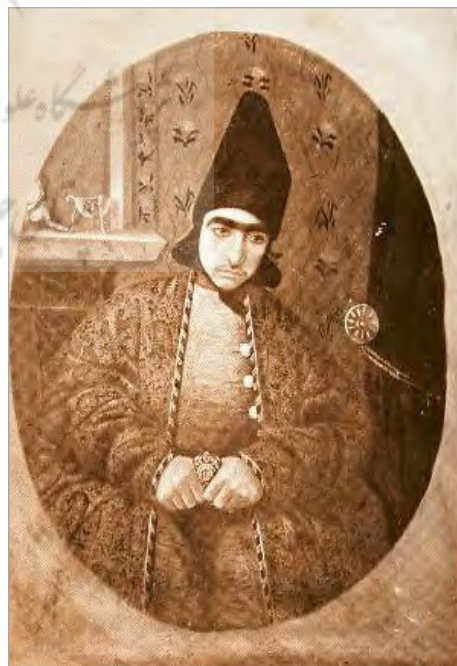
تصویر ۱۱. آنتوان سوریوگین، جسد ناصرالدین‌شاه در تکیه دولت، موزه اسمیتسونین (URL: 2)