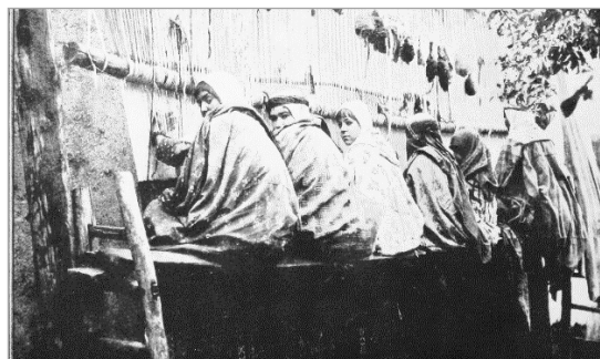
تصویر ۸. دختران قالی‌باف، آنتوان سوربوگین، ۱۸۹۵ (افشار: ۱۳۷۰: ۲۸۴)