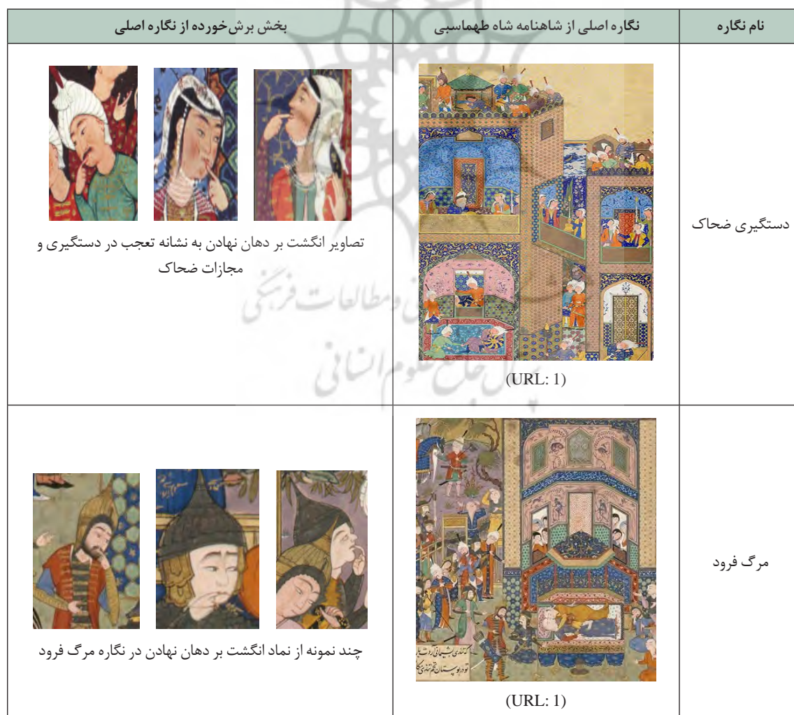
جدول ۴. نماد تصویری انگشت به دندان گذاشتن

که انگشت از آن پس نباید گزید» (فردوسی، ۱۳۵۳: ۱۹۹)