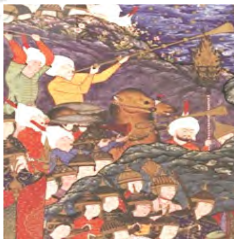
تصویر ۷. بخشی از نگاره نبرد منوچهر با تورانیان که زبان تصویری دست در موسیقی به هنگام جنگ را نمایش می‌دهد (URL: 1).