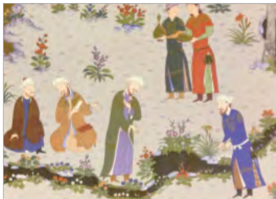
تصویر ۲. بخشی از نگاره ملاقات فردوسی با عنصری، عسجدی و فرخی (فردوسی، ۱۳۵۰: ۱۳)