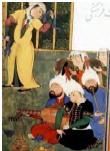
تصویر ۶. بخشی از نگاره دیدار سیاوش با فرنگیس و زنی با دستمال در دست به نشانه شادی دیده می‌شود. (URL: 1)

در نگاره جنگ منوچهر با تورانیان در شاهنامه طهماسبی (تصویر ۷)، از زبان تصویری "دست" در موسیقی به هنگام جنگ استفاده شده است. در این تصویر، مردان با لباس معمولی در حالی که سلاح‌هایی در دست داشته، جنگ را به نمایش می‌گذارند. سپاهیان سوار بر شتر با زدن نقاره، در دل دشمنان وحشت ایجاد می‌کنند. موسیقی نظامی از دیرباز، قوانین و آداب و رسوم مخصوصی داشت که در سفرنامه‌ها به آنها اشاره شده است. برادران شرلی در رابطه