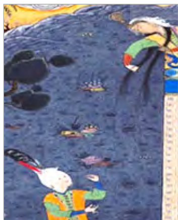
تصویر ۴. بخشی از نگاره شاهنامه شاه طهماسبی