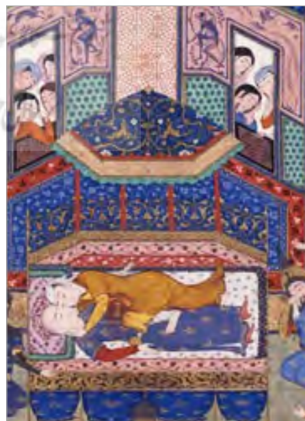
تصویر ۵. بخشی از نگاره مرگ فرود با صحنه‌های با دست بر سر زدن، با دست مو کشیدن و ... (URL: 1)