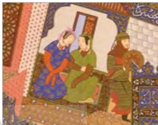
تصویر ۱۰. بخشی از نگاره هفت‌خوان اسفندیار، دو خواهر با دست‌های پنهان دیده می‌شوند (فردوسی، ۱۳۵۰: ۴۰۱).

در کتاب شاهنامه، رازداری را به لباسی تشبیه کرده که از بدن محافظت می‌کند و شعر زیر را در داستان هفت‌خوان اسفندیار سروده است. در کتاب شاهنامه بایسنقری که در دوره تیموریان تدوین شده، خواهران اسفندیار با داستان پنهان نقاشی شده‌اند (تصویر ۱۰).