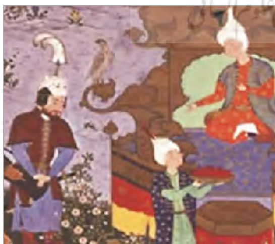
تصویر ۸. بخشی از نگاره دیدار رستم و کیقباد که زبان تصویری دست روی دست را نمایش می‌دهد (URL: 1).

بعضی دیگر از نگاره‌ها در شاهنامه طهماسبی به صورت نمادین، با ترسیم زبان تصویری دست، رفتارها و حالت‌های پیچیده افراد را آن‌گونه که در متن داستان شاهنامه آمده، به تصویر می‌کشند که در زیر به چند نمونه از آنها اشاره می‌شود: