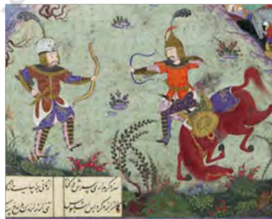
تصویر ۳. بخشی از نگاره نبرد رستم و اشکبوس مطابق متن شاهنامه

در نمونه دیگر از نسخه شاهنامه طهماسبی (تصویر ۴)، زال، پایین کاخ ایستاده و رودابه در کنار جان‌پناه (کنگره) بام کاخ است و تنها نیمه فوقانی بدن وی دیده می‌شود. نگاه آن دو به یکدیگر است. رودابه دو دسته از موهایی خود را از دو طرف شانه با دست گرفته و به بیرون کنگره آویخته و به سمت زال خم شده است. موهایی او بلند و حجم آنها زیاد است و دست‌های زال به گونه‌ای